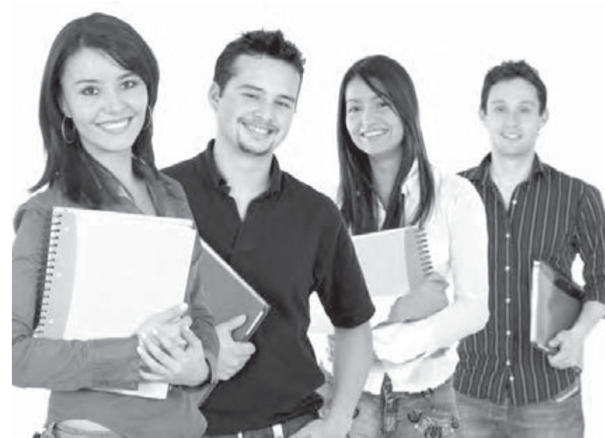
Предстоит учиться им в университете!

Ситуация с гуманитарным университетом выглядела немного иначе. В ряде факультетов МаГУ внедрили болонскую систему образования. Получить высшее образование на бюджетной основе при этом можно на бакалавриате. Повышенный интерес был традиционно к факультетам информатики, экономики и управления и психологии. Не снижается популярность среди