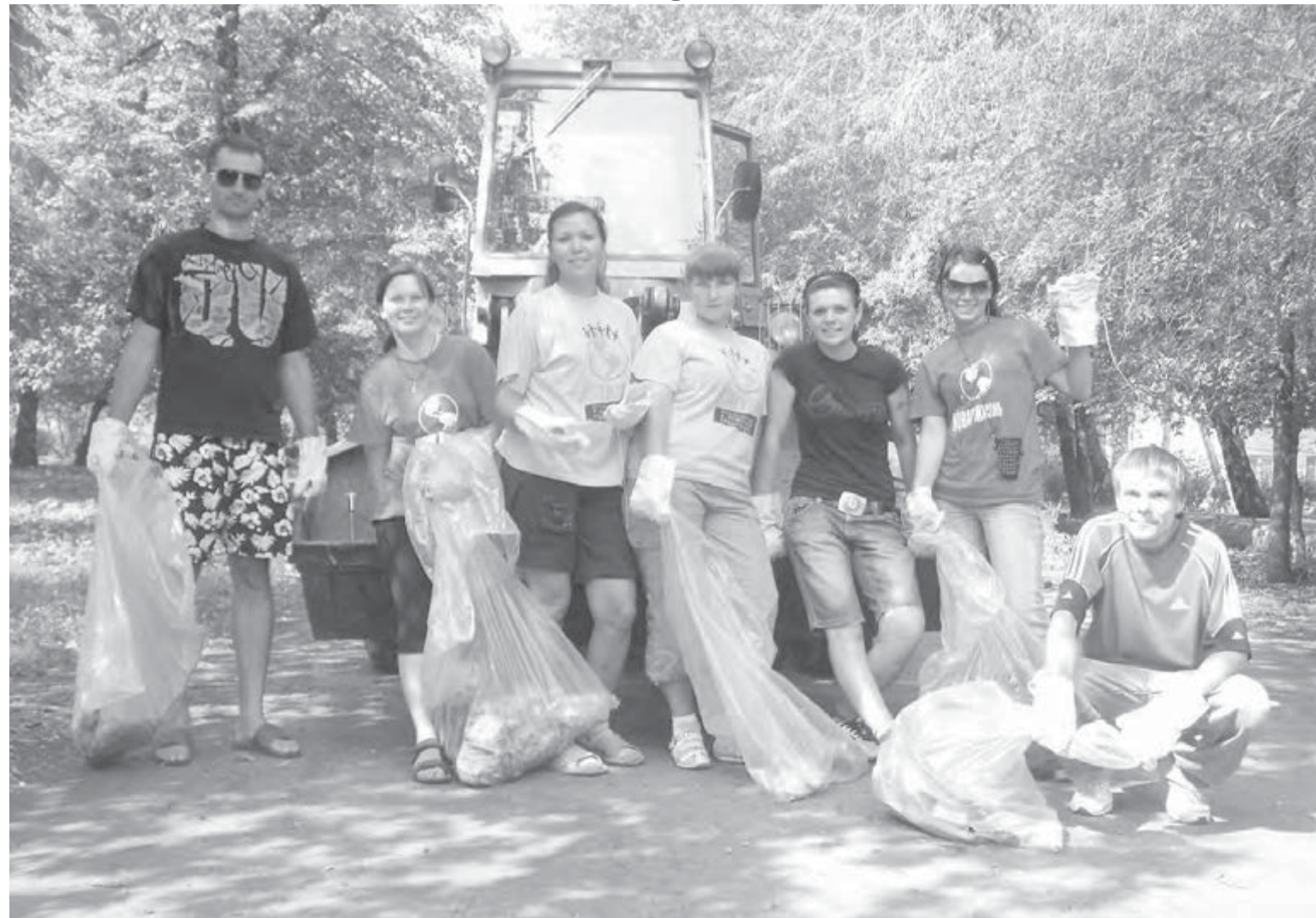
• Эх, взяли дружно!