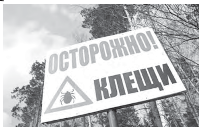
● Берегись: такие «товарищи» нам не друзья!

С начала года на территории Магнитогорска было зарегистрировано 1057 обращений с укусами клещей. Каждые 2-3 часа нужно осматривать одежду, обращая внимание на швы и карманы, и снимать с одежды найденных клещей. Не пренебрегайте осмотром тела: клещи чаще всего присасываются в области шеи, груди, в подмышечных впадинах и паховых складках, на волосистой части головы, а также в локтевых и коленных сгибах. Нужно помнить, что клещей можно завести в город на букетах из цветов и трав, на одежде, на шерсти домашних животных, поэтому, вернувшись с отдыха, нужно еще раз тщательно осмотреть одежду, обувь, а также домашних животных. Укус клеща не чувствителен, поэтому паразит может находиться незамеченным на теле человека до десяти дней и все это время питаться кровью своего «хозяина».