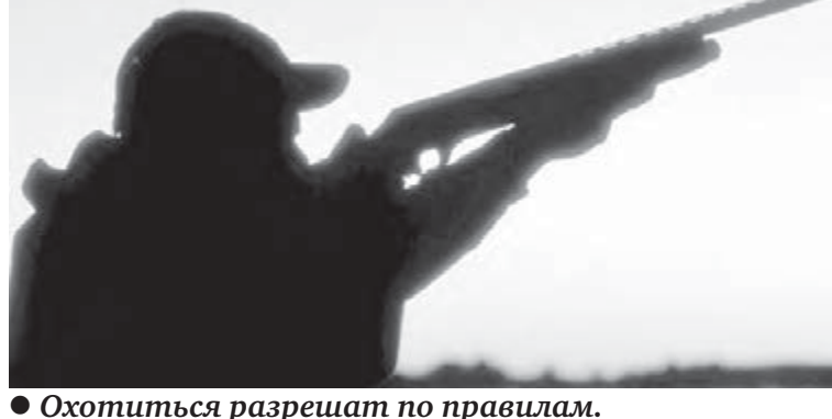
Охотиться разрешат по правилам.

Разрешения на путевки (договоры) выдаются подразделениями «Облохотрыболовсоюз» на закрепленные за ними в установленном порядке егерские участки и в охотничьи хозяйства, а также непосредственно «Облохотрыболовсоюзом» в пределах 15 процентов от их общего количества. Выданные «Облохотрыболовсоюзом» путевка без регистрации в охотничьем хозяйстве недействительна.