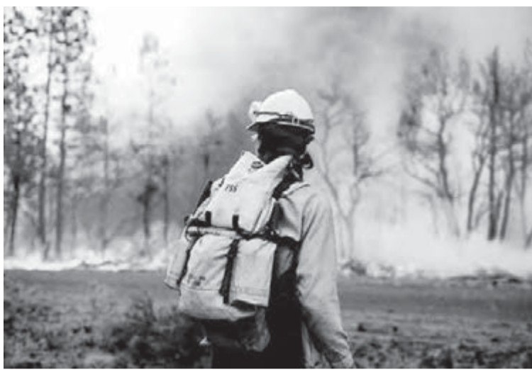
● В такое пожароопасное лето у огнеборцев много работы.

Главам муниципалитетов Челябинской области поручено подготовить и содержать в готовности необходимые силы и средства для защиты населения и территорий от чрезвычайных ситуаций. Им предстоит организовать выполнение мероприятий по противопожарному устройству земель, на которых располагаются леса, сделать противопожарные барьеры