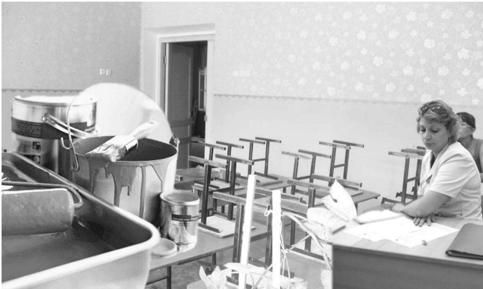
● Еще чуть-чуть, и обновленные классы встретят мальчишек и девочек.