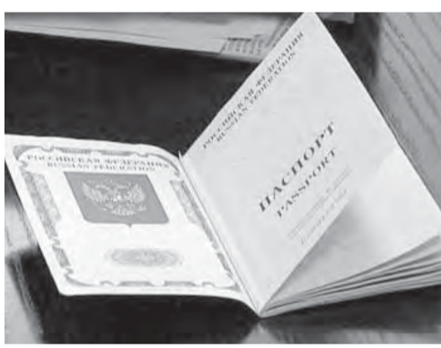
● Документы требуют строгого порядка.

На детей, родившихся до 1 июля 2002 года, заполняется заявление об оформлении наличия гражданства России. Другим это не требуется, но это при условии, если на момент рождения детей родители являлись гражданами России. Если один из родителей на то время имел гражданство другой страны или был лицом без гражданства, процедура