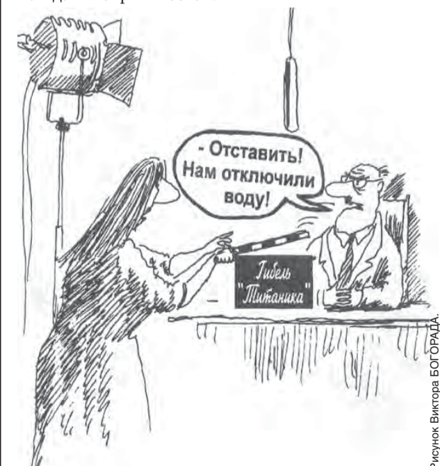
Рисунок Виктора БОГОВА

Так что любой долг (будь то штрафы ГИБДД, алименты или коммунальные платежи) является обременением и может повлиять на любую жизненную ситуацию. Несвоевременная оплата услуг лишь добавляет хлопот. Казалось бы, чего проще – вовремя заплатить за потребленные услуги! И быть спокойным, не ждая неприятностей!