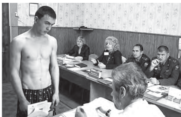
Государство возьмет на контроль каждого новобранца.

Министерство обороны России при поддержке руководства страны продолжает радикальную военную реформу.