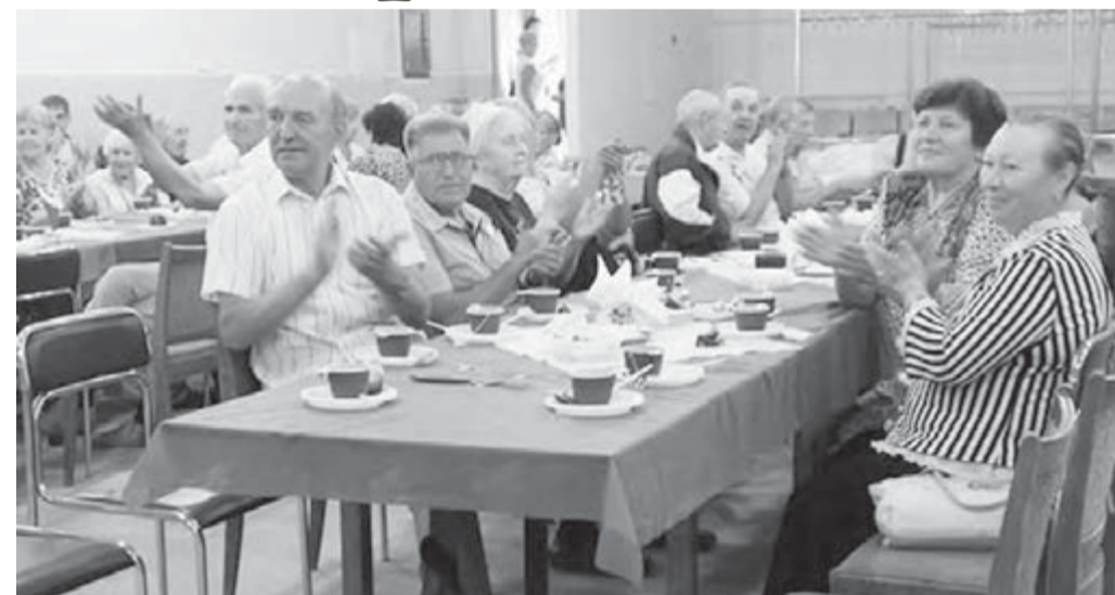
Череда «строительных» торжеств набирает ход.

Инициатором мероприятия выступило руководство ОАО, первые лица предприятия тепло встречали ветеранов, поздравляли их с наступающим профессиональным днем.