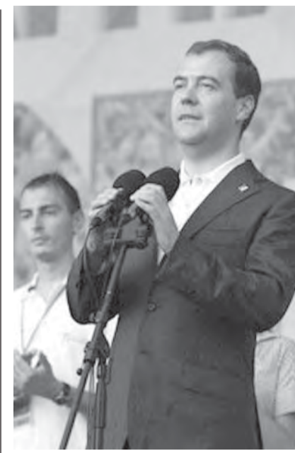
• Президент страны сделал ставку на молодежь.

мий и дивизий, освобождавших наши города. А утром 2-го августа у монумента «Тыл и фронт» прошел митинг, посвященный дню ВДВ.