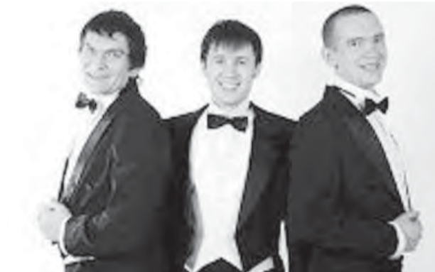
Наши «Контраст» всем фору даст!

Эта победа позволила магнитогорским музыкантам получить официальную рекомендацию и финансовую поддержку от творческой школы «Мастер-класс» для участия в престижнейшем 63-м международном конкурсе «Кубок мира», который состоится 19-25 октября 2010 года в хорватском городе Вараждин.