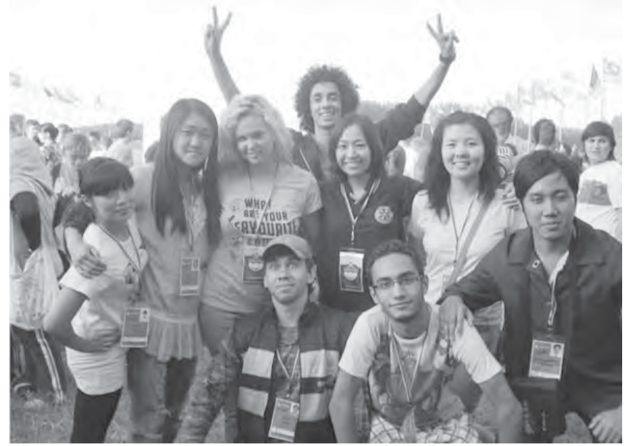
• Их подружил Селигер.

С технической поддержкой. На нем помимо информации о деятельности фонда планируется создание базы детей-сирот Магнитогорска и приемных родителей с последующей интеграцией в подобный проект всероссийского уровня «Ванечка».