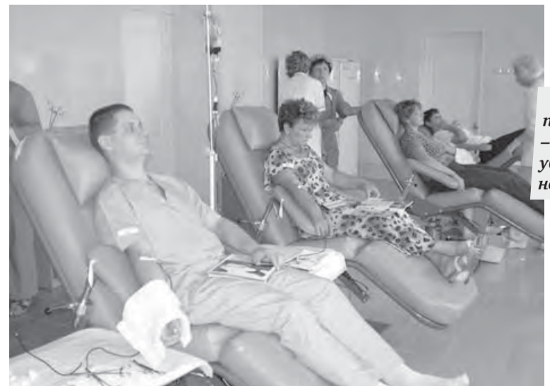
Многие считают сдачу крови своим гражданским долгом.

Более подробную информацию вы можете узнать на «горячей линии» 8-800-333-33-30 (звонок по России бесплатный).