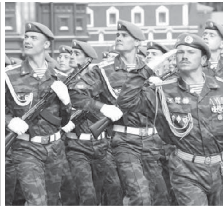
• Элита российской армии – воздушно-десантные войска.

лось как минимум полгорода, ахали, наблюдая, как бойцы по-настоящему укладывали друг друга на асфальт, демонстрируя приемы борьбы. В дополнение ко всему мастера парашютного спорта продемонстрировали прыжки с парашютом.