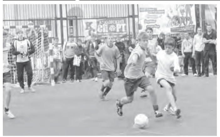
• Лучше гонять за мячом, чем за пивом.