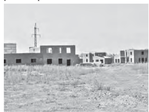
● Несостоявшийся ФОК – состоявшийся поселок.

осуществляться строительство спортивного объекта, в действительности началось возведение жилого поселка. При таком раскладе год назад земля должна была выделяться по аукциону, а о бесплатном выделении участка и речи быть не могло.