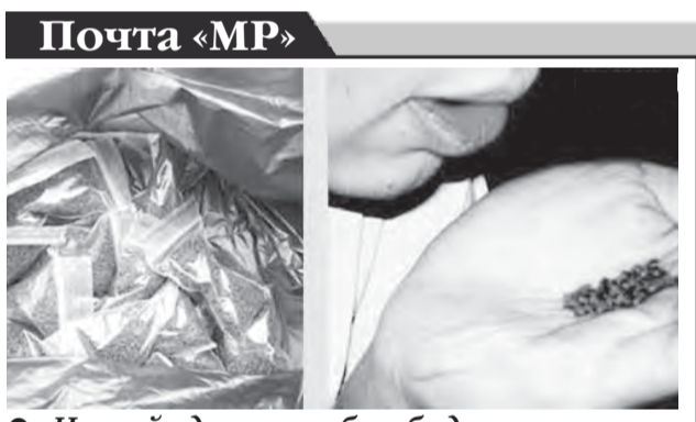
Насвай далеко не безобиден.

С началом эпохи авиалайнеров авиационно-технические специальности изменились. Техническое обслуживание «Боингов» и отечественных судов в транзитных аэропортах не выполняется – только наземное и оперативное.