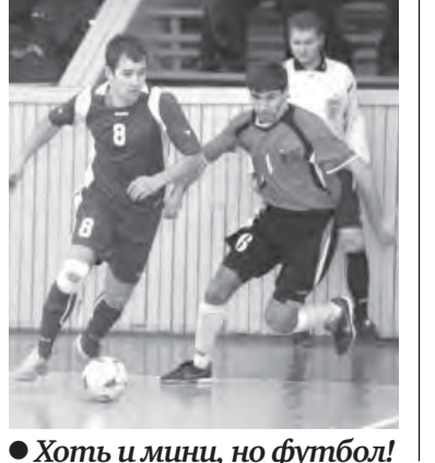
Хоть и миц, но футбол!