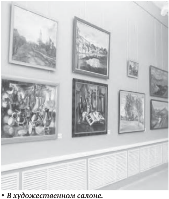
• В художественном салоне.