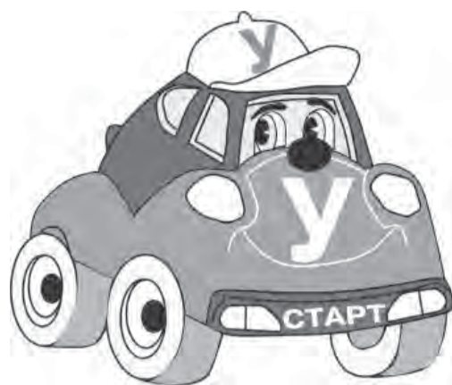
● Каким будет старт новоспеченного водителя, зависит от автошколы.

Сейчас их принимают исключительно в ГИБДД. Также вводится обязанность автошкол организовывать бесплатную подготовку абитуриентов, если те не сдали экзамен три раза подряд. Курс повторного обучения не может длиться менее пяти часов. Предполагается, что таким образом впервые будет введена материальная ответственность автошкол за некачественную подготовку водителей. Еще новое: россия-