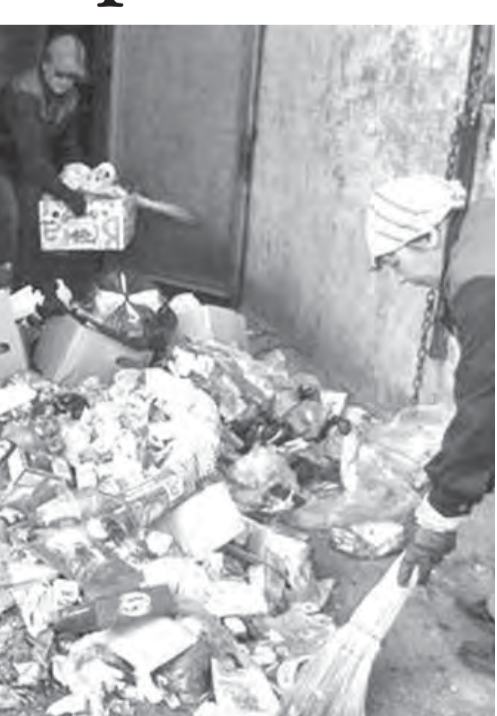
● Увидите такое – звоните.

В Орджоникидзевском районе административная комиссия также будет собираться каждый второй и четвертый четверг месяца с 16.00. Заседания будут проходить по адресу: ул. Маяковского, 19/3, каб. 406. Телефон «горячей линии» – 49-05-93.