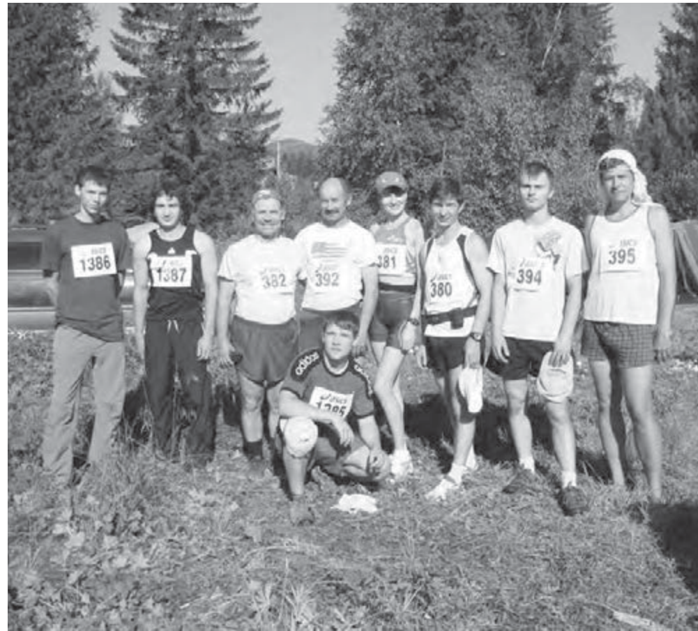
• Магнитогорские участники забега на Конжак.

«Бегу уже три часа. Ноги гудят, и дыхание на пределе. Нет, бегом то, чем мы сейчас занимаемся, назвать нельзя. Это, скорее, быстрый шаг по большому и шершавым камням вершинного гребня. Бег был внизу от старта и до начала крутого каменистого подъема. А теперь, перескакивая и переступая с камня на камень, постепенно набираю высоту, иногда помогая себе руками. Что-то очень круто. И очень жарко. Уже слышны голоса на вершинном пункте питания: «Воды осталось мало, всего полстакана на участника». Но жажда это радует – можно хоть немного утолить жажду. На подступах к завешенному стакану попадаю в цепкие руки судей и получаю отметку – печать на нагрудном номере. Все, я на вершине 1569 метров самого высокого горного массива Свердловской области. Позади половина дистанции.