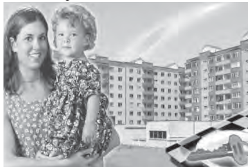
● Государство им поможет.