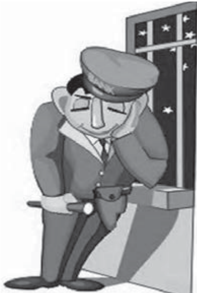
● Очень трудно на работе сон и скуку одолеть.

Сегодня дело «о растрате» передано в суд. Благодаря тому, что сотрудник охраны погасил долг и раскаялся в содеянном, скорее всего, возможен примирительный приговор. А ведь могло кончиться все печально: по такой вот глупости можно вполне заработать судимость – статья 165, часть 1 «Причинение имущественного ущерба без признаков хищения» – срок до трех лет.