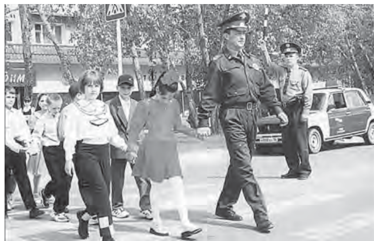
● Безопасность детей на дороге – забота не только ГИБДД.