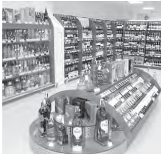
● Алкогольному рынку нужны правила.

Кодекс чести участников алкогольного рынка также предусматривает ряд моральных обязательств перед покупателями, в том числе его статьи запрещают торговать контрафактной продукцией, а сама деятельность производителей и продавцов должна способствовать повышению престижа отрасли, установлению