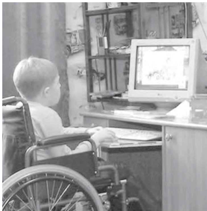
● Доступ к образованию должен быть у каждого.