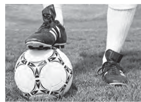
со счетом 0:2.