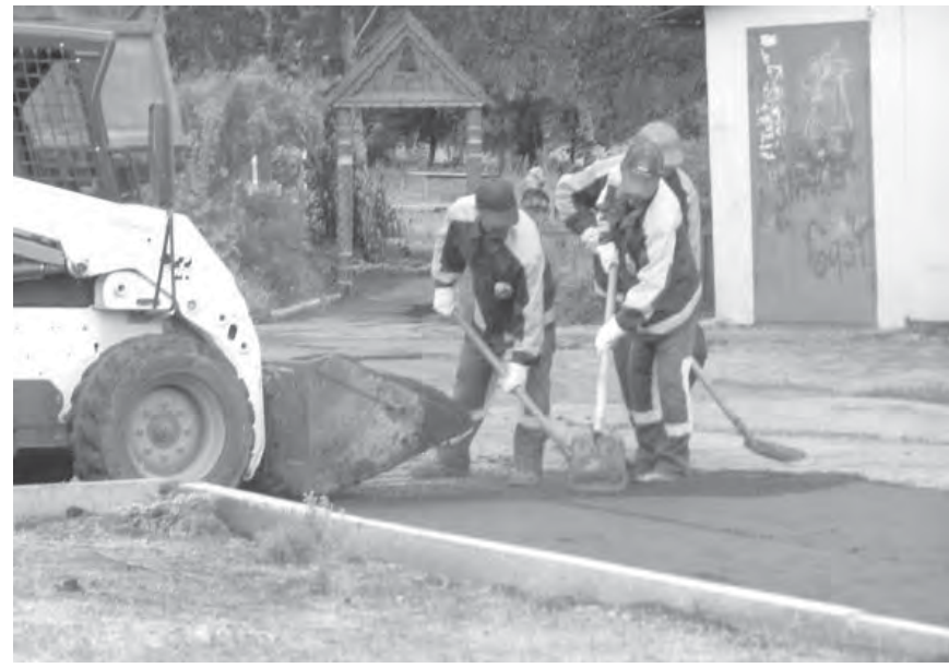
● Сухая погода для укладки асфальта – благо.

Основная тяжесть работ легла на плечи ЗАО «Южуралавтобан». Работники этого известного в обла-