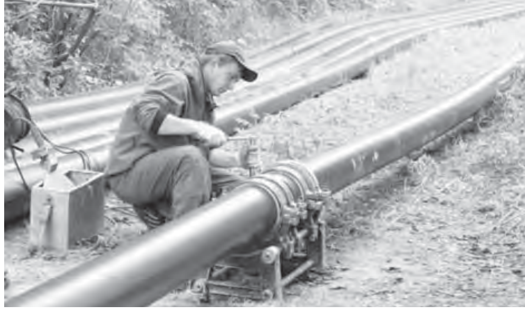
● Работу по газопроводам должны вести специалисты.

Всем жителям, пользующимся газом, работники «Магнитогорскгазком» при техническом обслуживании выдают абонентские книжки, в которых указаны номера телефонов соответствующих эксплуатационных подразделений, и главное – телефон «04» работающей круглосуточно аварийно-диспетчерской службы. Существует и еще один телефон для связи. Набрав номер 20-95-99, горожанин может получить ответы на все вопросы, связанные с эксплуатацией и реконструкцией газового оборудования в жилых домах.