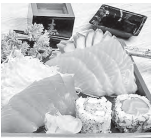
● Нас ждут кулинарные шедевры.

и непременно с сюрпризами. Что-то, а удивлять наши организаторы умеют. Так, одним из главных событий вечера станет незабываемое бармен-шоу, которое, к слову сказать, не так уж и часто удается лицезреть. Но это не все. На фестивале обещали заглянуть и челябинские гости, которые проведут мастер-класс под названием «Английская техника изготовления цветочных композиций». Да, кстати: все фестивальные блюда будут дегустироваться абсолютно бесплатно. Вход на мероприятие свободный. Словом, приятного вам времяпрепровождения и... приятного аппетита!