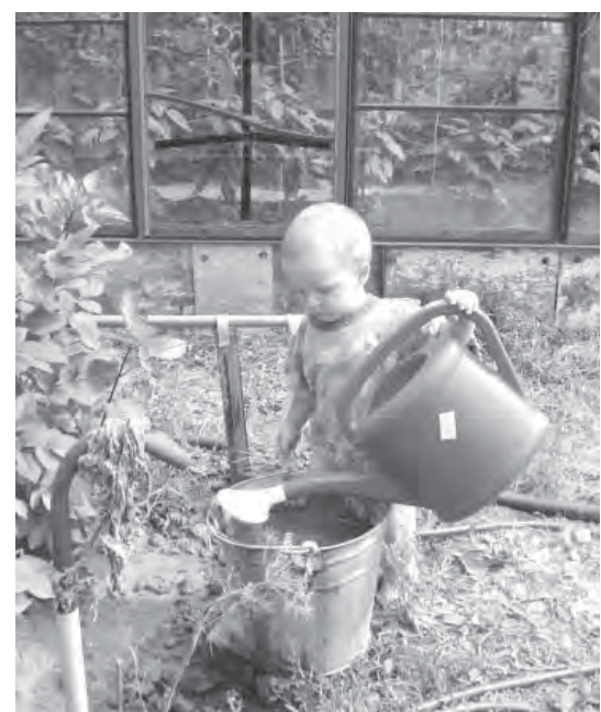
● Нынче каждая капля дорога.

В этой обстановке не последнее дело – милость природы. Прошедшие дожди нынешним летом, даст Бог, не последние.