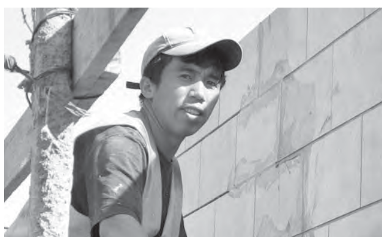
● Каждому мигранту – по патенту.

Напомним, 1 июля этого года вступили в силу изменения трудового законодательства о работе граждан СНГ в личном хозяйстве россиянина. Введено два новых понятия