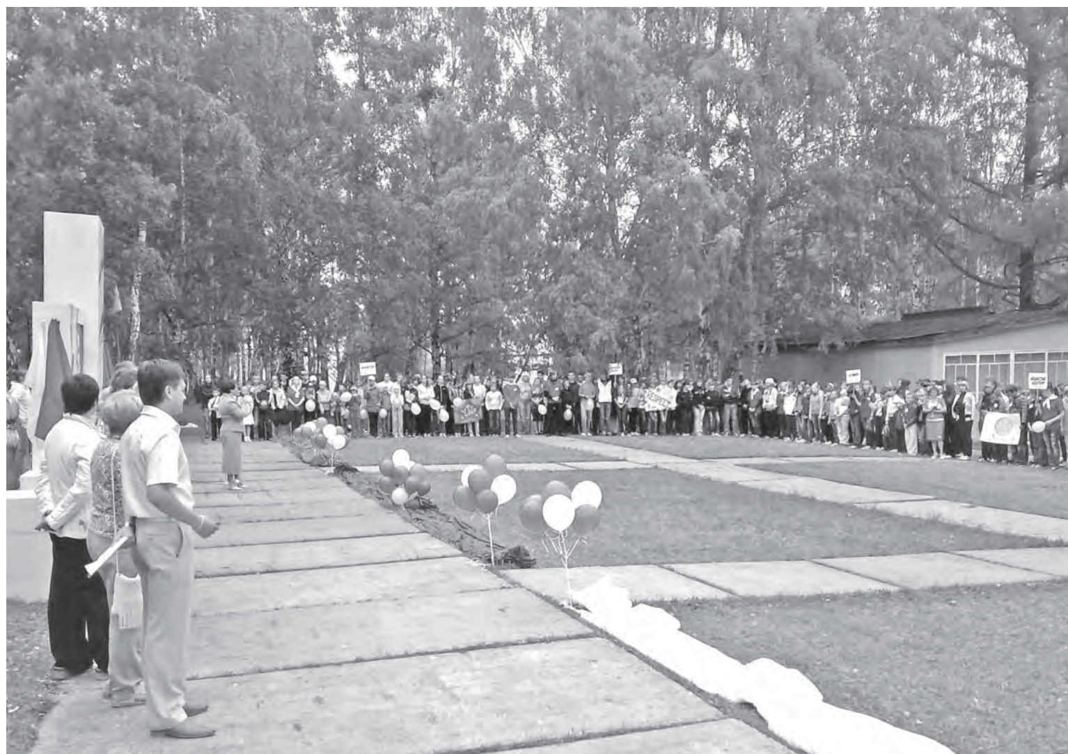
«Абзаково» стало местом сбора одаренных ребят со всей области.