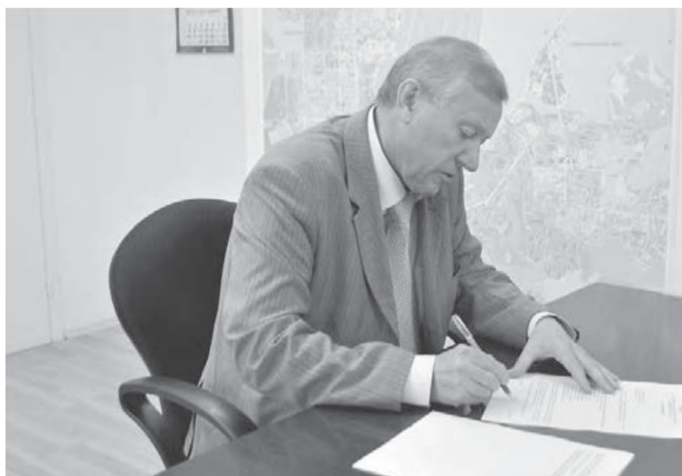
● Глава города ставит свою подпись под списком.

В Магнитогорске избран костяк городской Общественной палаты.