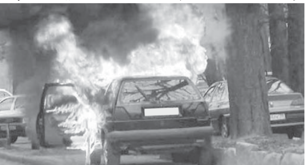
● Огонь полностью уничтожает автомобиль за 5-7 минут.

Очень любопытный способ освобождения мест на дворовой парковке используют автолюбители, проживающие в густонаселенных южных микрорайонах города. Если мест на стоянке нет, то они появляются после поджога пары-тройки машин. Водители надолго запоминают «урок» и ищут для своих «коней» более безопасные парковочные места.