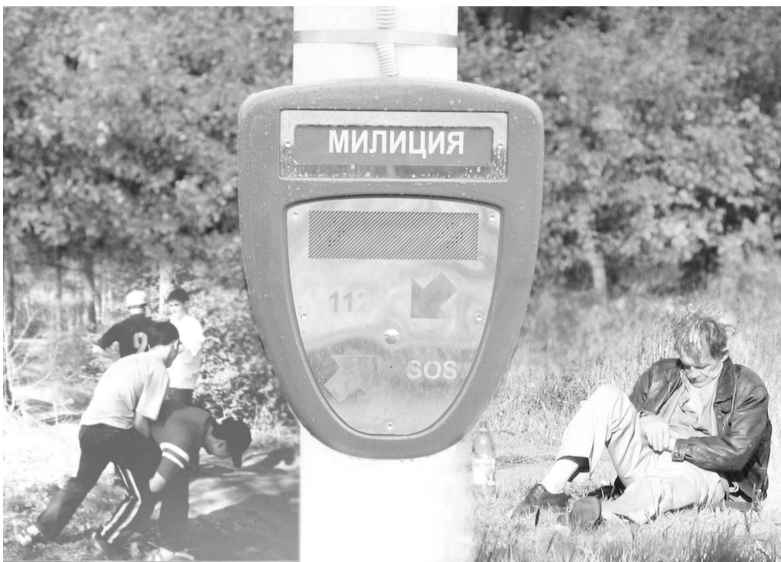
• Кнопка экстренного вызова в людном месте.