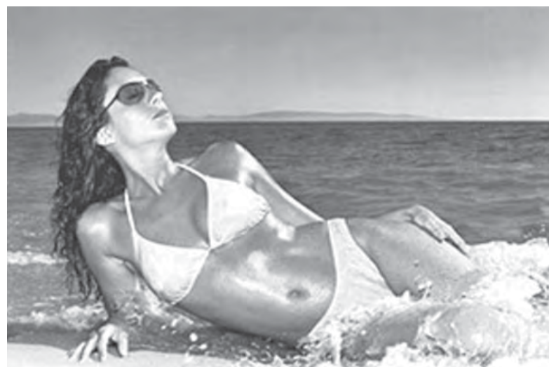
● Отдыхайте на всю катушку!

В сложившейся практике взаимоотношений тех, кто дает работу, и тех, кто ее исполняет, присутствует и условно легитимная схема, когда работник пишет заявление на отпуск, получает отпускные, но при этом продолжает выполнять свои служебные обязанности. Такая схема приемлема, особенно для тех работников, которые получают за свой труд зарплату в «конверте». Теперь же предполагается, что договориться с работодателем