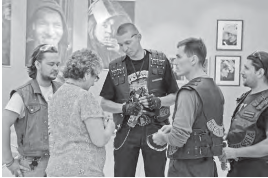
Байкеры на выставке.

«Самое сильное впечатление на меня произвело доменное производство, – рассказывает один из авторов, фотограф Андрей Серебряков. – Я вижу огонь, он подавляет меня,