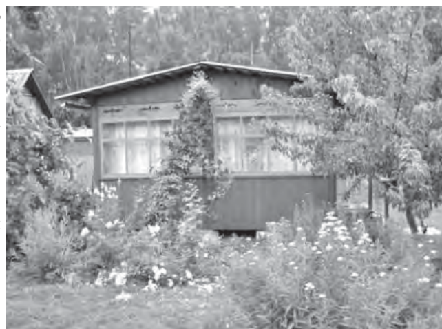
Оборвав право на землю, оформите и право собственности на садовые строения.

Если же родители умерли, а сад надо оформлять на наследников, то придется через суд доказывать право собственности на этот сад за умершими родителями. И уже с решением суда наследник получит у нотариуса свидетельство о праве на наследство.