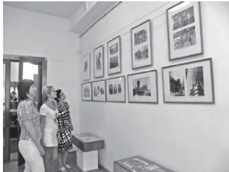
● На выставке в музее истории Магнитостроя.

Война – это беда. А на фотографиях – улыбки, жизнерадостные лица, как будто и не валился рядом снаряды, не гуляла поблизости смерть. Наши