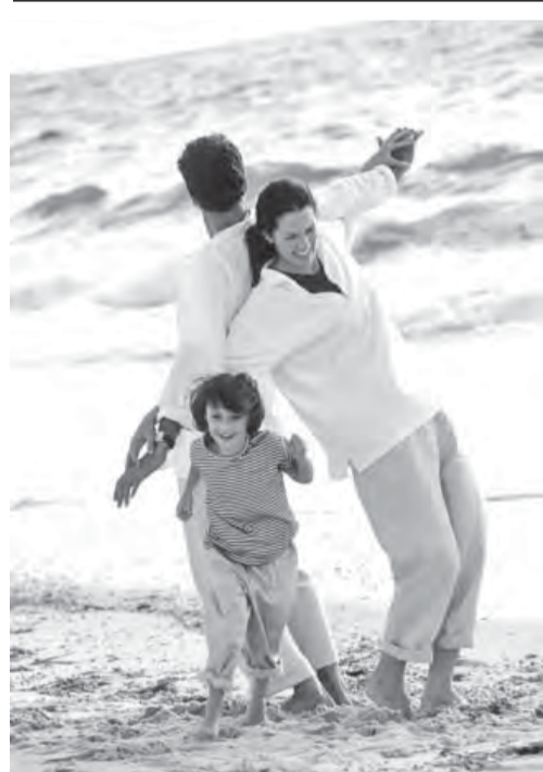
● Что такое счастье?