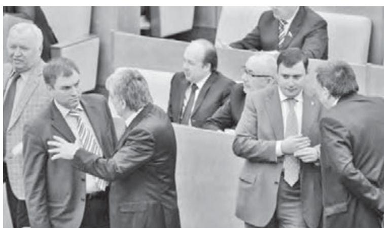
● На Охотном ряду – дебаты.

О том, что в очередной раз делаются шаги в социальной сфере, говорили многие. «Когда утверждался бюджет на 2010 год, были сокращены расходы на село, культуру, спорт. Теперь надо добавлять. Это же касается наших долгов перед ветерана-