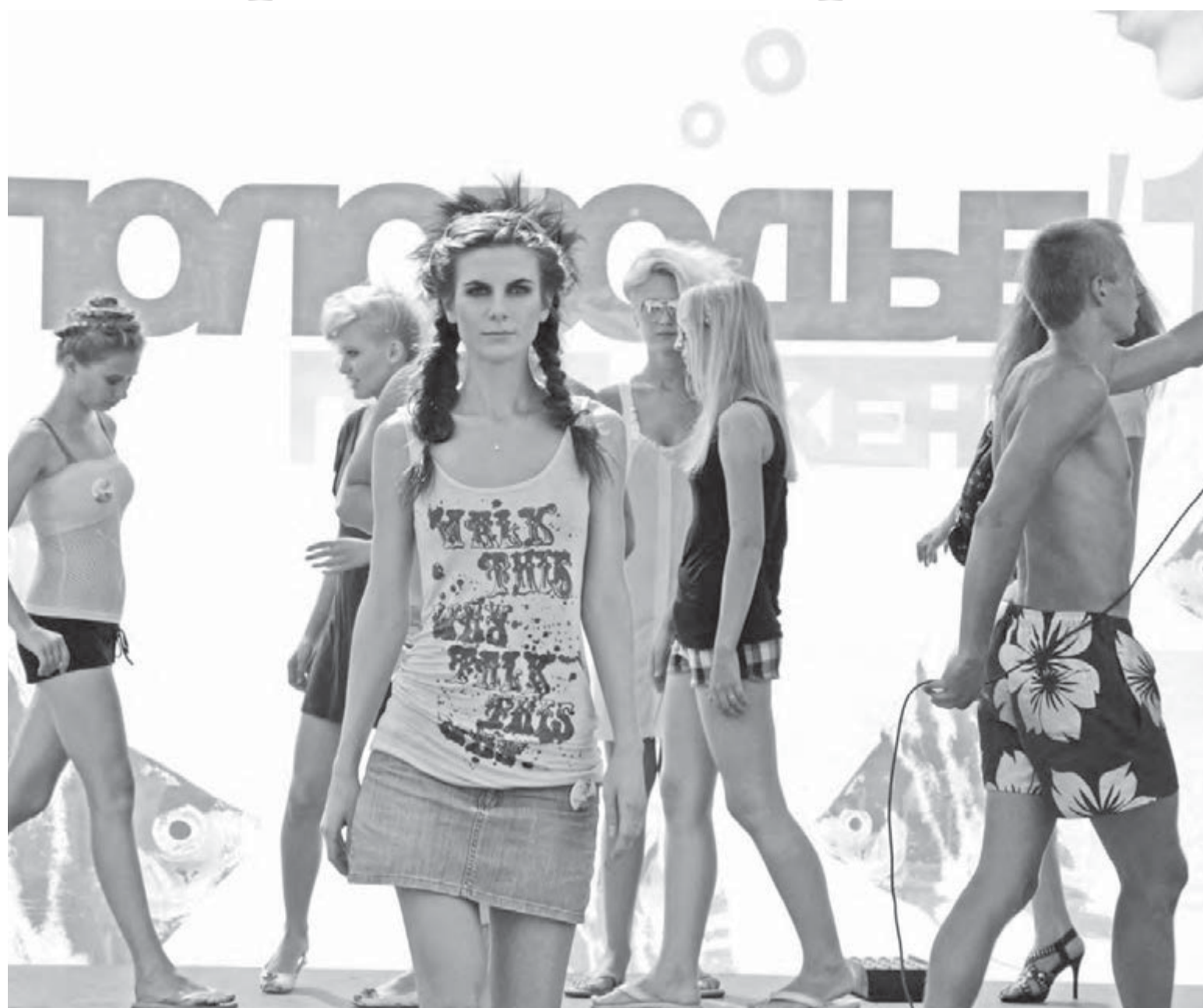
• «Половодье» снова накрыло Магнитку 25 июня.