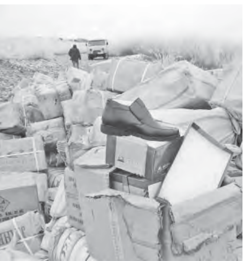
• Контрабанда на границе.

Уместно говорить о качестве того, что предлагает нам рынок. Контрабандные товары продолжают ввозить в Россию, а таможня продолжает бороться с незаконным перемещением дешевых, низкокачественных товаров.