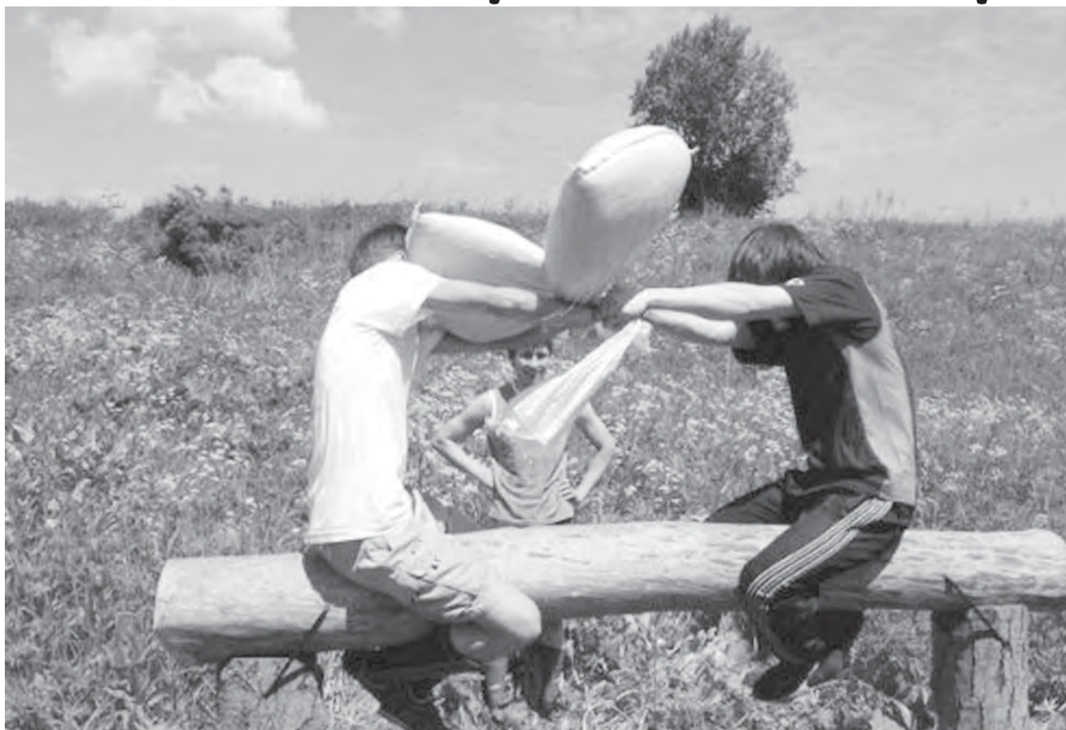
● Батыры на Сабантуе: кто кого?