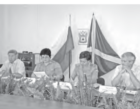
• Таможенники «дали добро».

обсудили реализацию таможенной политики на Урале.