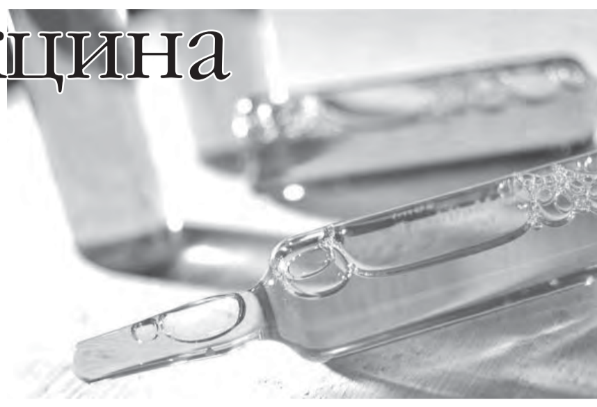
• Вакцинировать детей от полиомиелита будут бесплатно.

Вакцинация от полиомиелита переносится хорошо и, как правило, не вызывает нежелательных реакций.