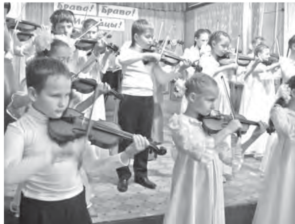
• Выступает «Концертино».