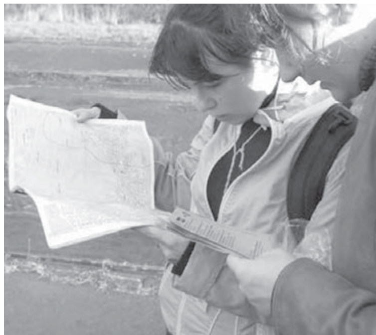
● Девушки, учитесь ориентироваться.

В соревнованиях по городскому ориентированию участвуют команды численностью от одного до четырех человек. Стать участником может каждый, вне зависимости от его возраста и физической подготовки. Хотя большинство участников соревнований – молодежь: студенты, молодые специалисты. В целом возрастной охват гораздо шире: мак-