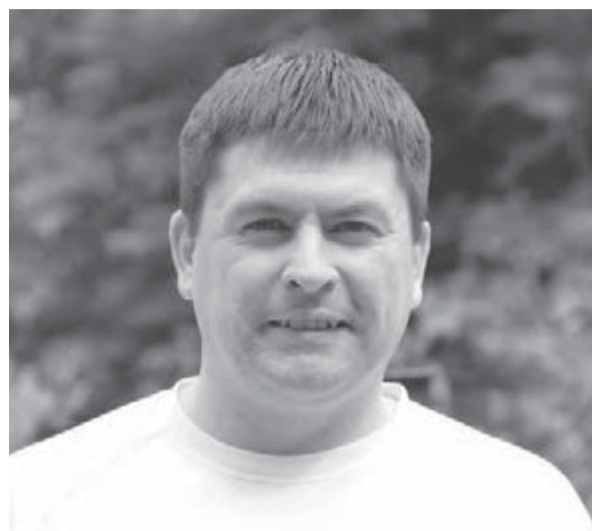
● Александр – по-гречески «защитник».

//Анатолий МЕЛЬНИКОВ