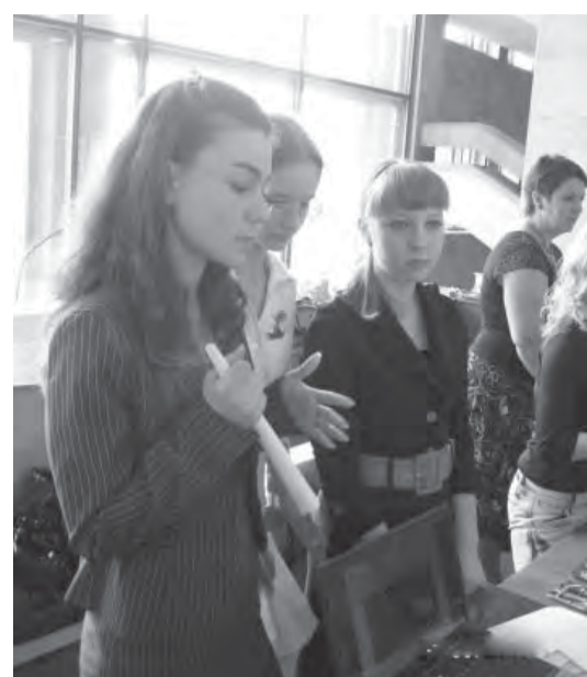
● Молодежные проекты идут на ура.

Проект студентов из МГТУ по производству