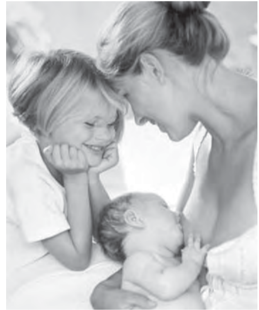
● Женское счастье...

телями продукции «СИТНО» за три дня, предшествующих празднику, было собрано 2740 подарков. Наибольшую активность проявили покупатели магазинов «СИТНО-10» (пр. Ленина, 141/5), «Гастроном» (пр. К.Маркса, 115), «Гум-Урал», «Продукты-6» (пр. Ленина, 129/2), розничный магазин (ул. Вокзальная, 15). В день праздника все собранная сладости, игрушки, книги были вручены детям, обе-