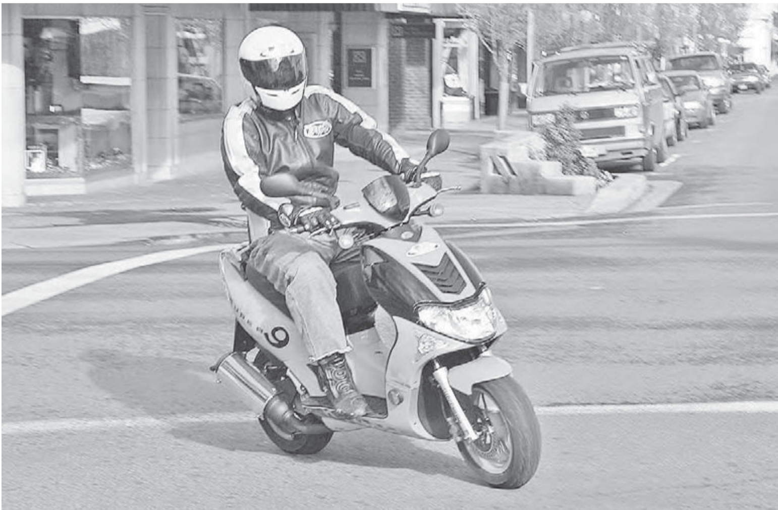
● В коже, шлеме, но без прав.