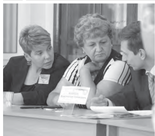
● На конференции отбирали лучших.