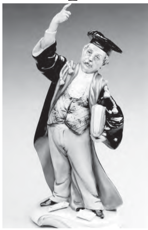
● Закон prevyше всего!

В случае попытки передачи защитником подозреваемому или обвиняемому запрещенных к хранению и использованию предметов, веществ и продуктов питания свидание немедленно прерывается, – говорится в законопроекте. Для адвокатов ничего не изменилось. Пронести подобные вещи и раньше было нельзя, только теперь