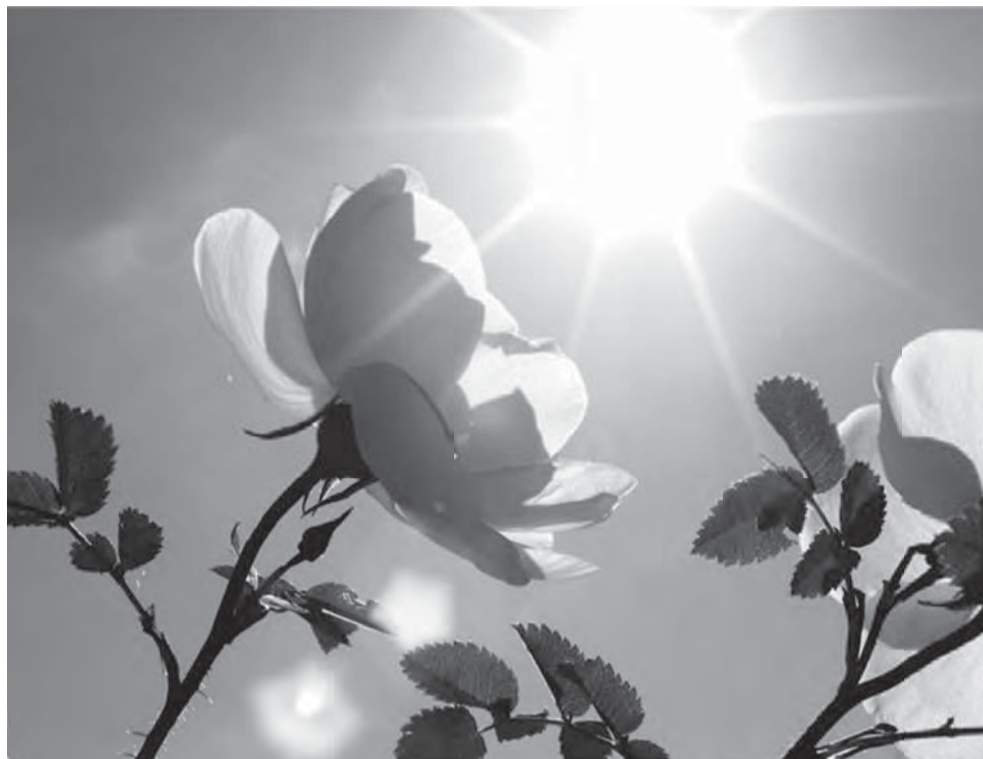
• Солнечный вальс июня.

Благодаря высокой майской температуре все процессы, происходящие обычно в природе, явно ускорились – что коснулось и огородных культур, и лесных растений.