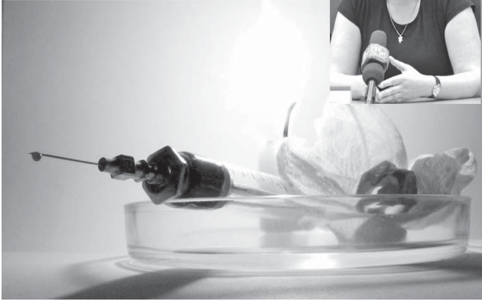
● Наркомани не должно быть места на планете.