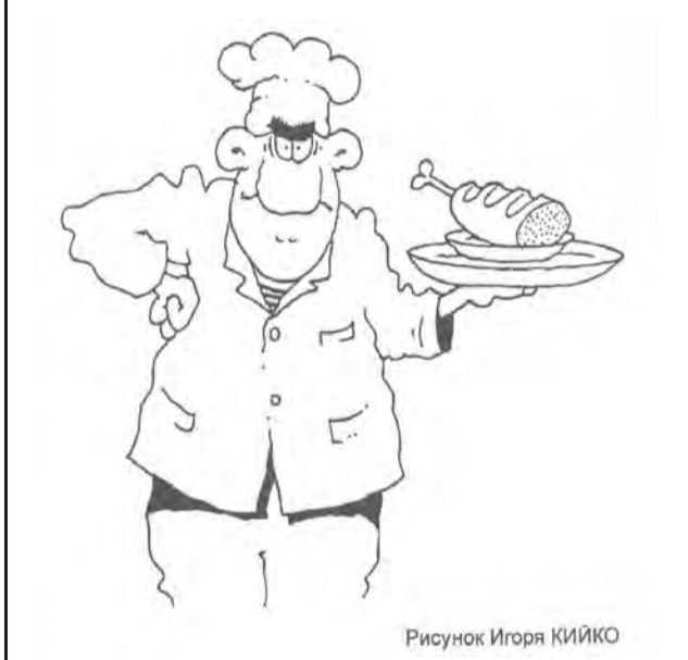
Рисунок Игоря КИЙКО

Согласно статистике, до 15 процентов всех летних отравлений приходится на некачественные шашлыки.