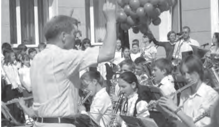
На городском празднике песни.