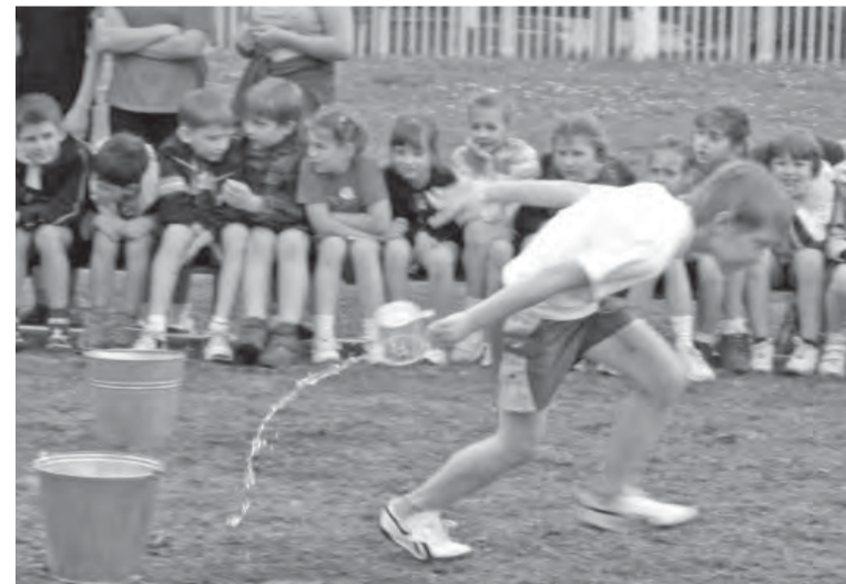
● В эстафете без воды и ни туды, и ни сюды...

В торжественном параде-открытии примут участие 32 команды (участники эстафет) – это воспитанники детских садов города. В холле Дворца бу-