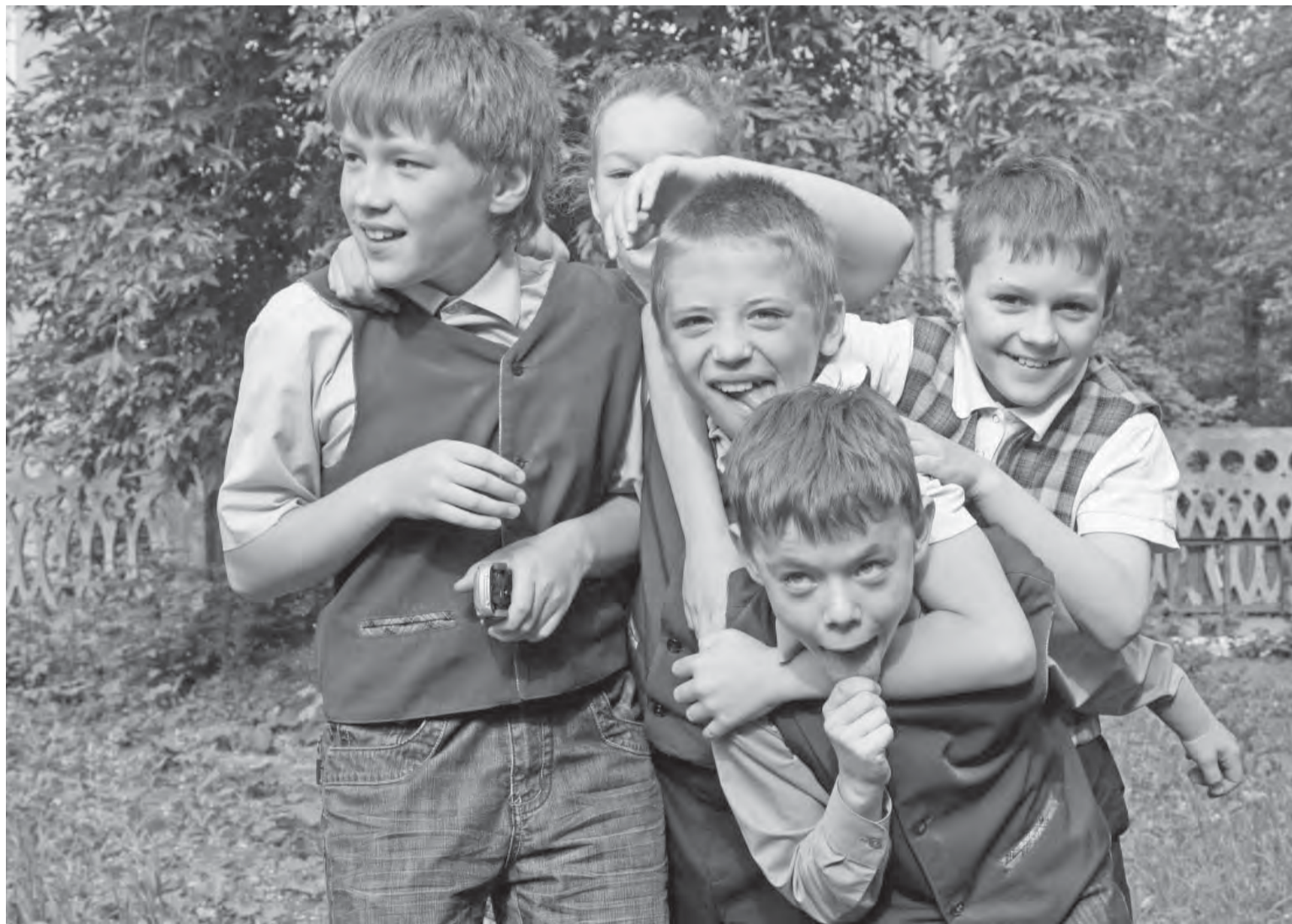
● Праздник – это такое состояние души...