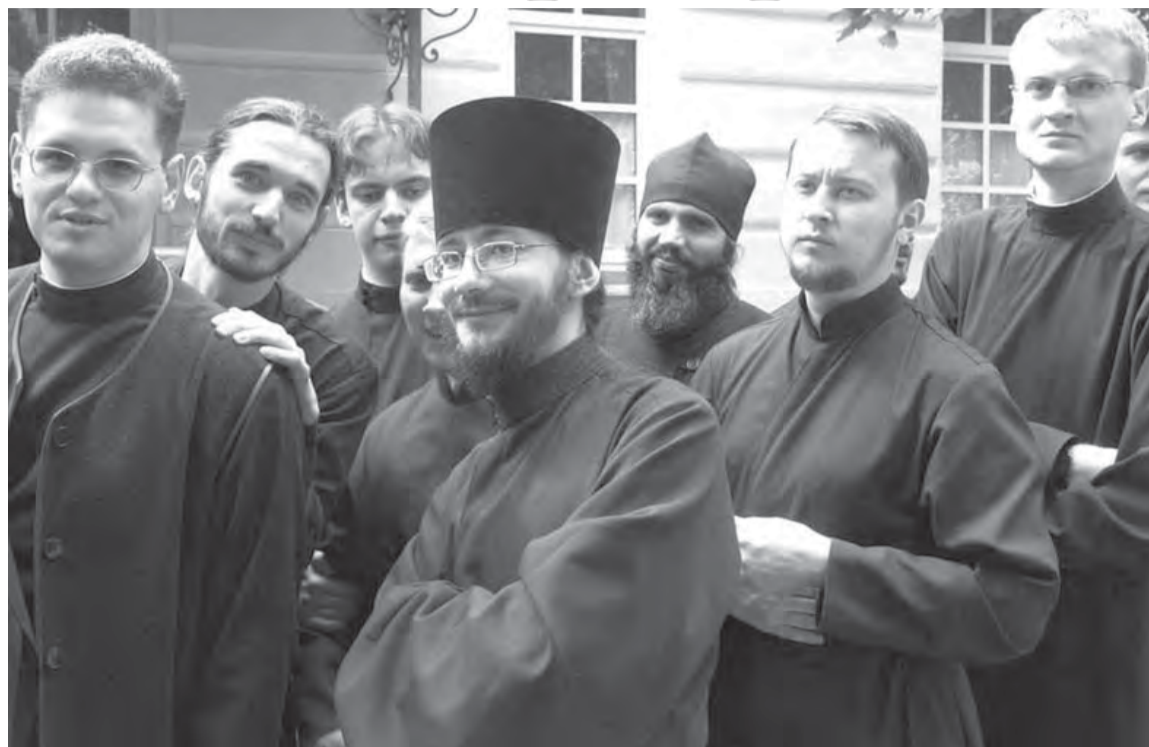
Православная церковь озабочена притоком в свои ряды молодежи.

В московском Свято-Тихоновском православном университете открыт факультет, который будет готовить социальных работников, педагогов и молодежных лидеров. «В каждом регионе можно подумать о том, как использовать для подготовки церковных