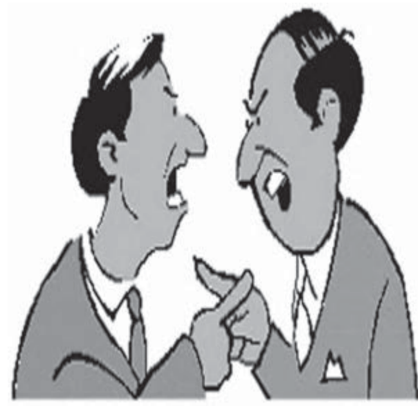
«Политическая жизнь должна быть острее».

Дебаты были сняты на видео, по просмотру которого специальная комиссия будет выбирать лучших ораторов и приглашать их на московский чемпионат по «STEREODEBATAM».