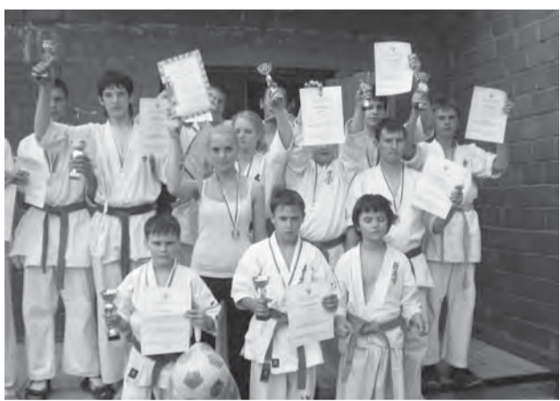
• Юные каратисты из ДЮСШ № 11.

Воспитанники детской спортивной школы своими победами подтвердили и другой жизненный принцип великого Масутацу Оямы: «Залог победы над собой и другими – абсолютная целеустремленность».