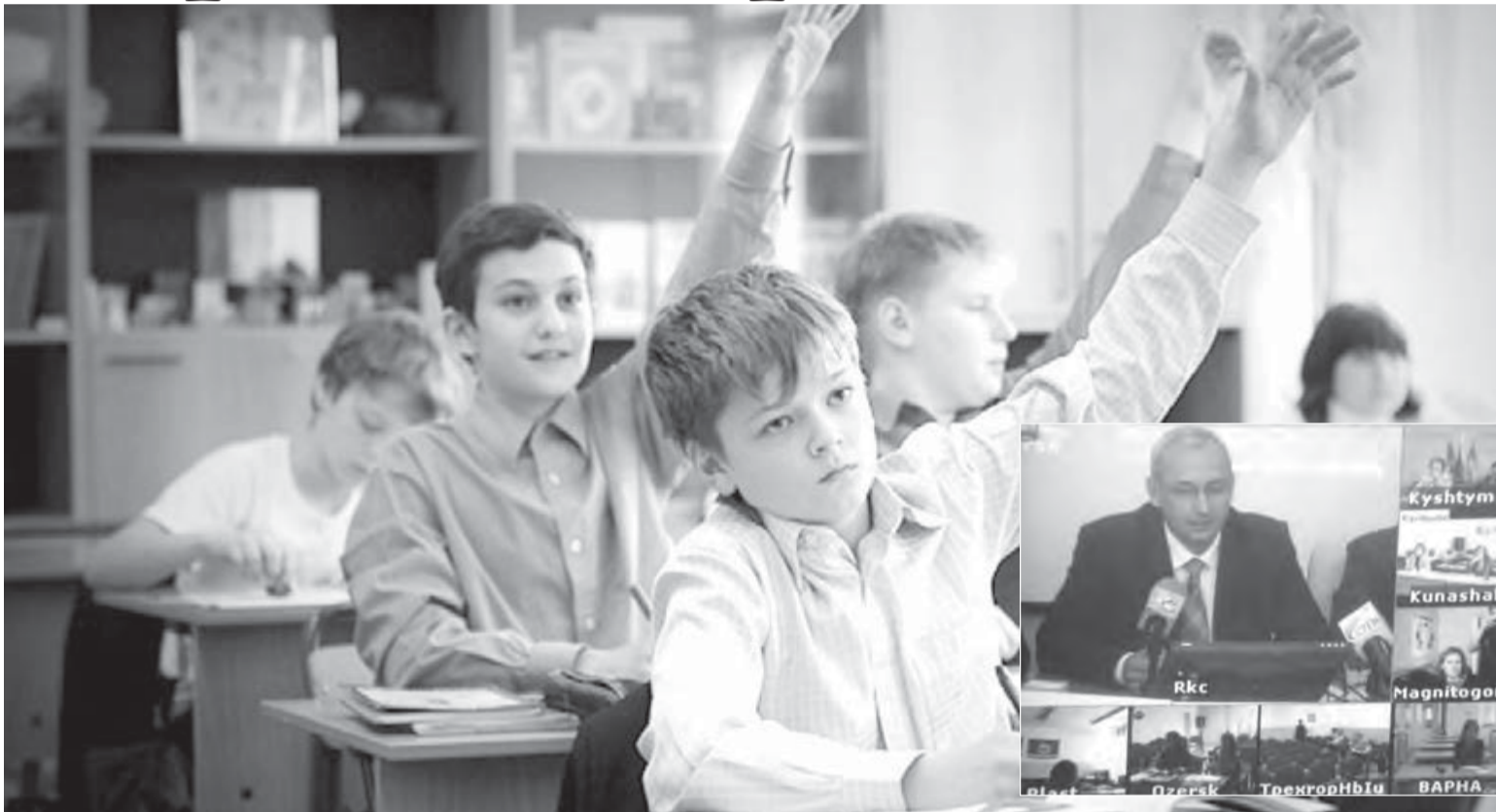
• Школа сама решит, как лучше.