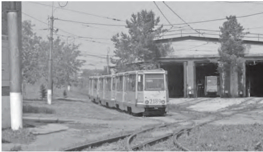
«Веер» будет сокращен.

У работников предприятия возник вопрос: почему именно консервируют второе, а, скажем, не первое депо, которое строилось 75 лет назад, ведь возраст второго значительно меньше – ему 49 лет? Ответ руководства таков: в первом депо расположен вагоноремонтный завод, который капитально восстанавливает вагоны, продляя им жизнь как минимум на десятилетие. Перенос ремонтной базы во второе депо потребует немалых средств. При таком дефиците бюджета это практически невозможно. Консервация третьего депо даже не поддается обсуждению – оно самое новое. И, кроме того, в 142-м микрорайоне расположен электромонтерный цех, обеспечивающий деталями и запчастями магнитогорский электротранспорт. Потому в жертву приносится второе депо. Расчеты показали, что консервация высвобождаемых зданий, сооружений, помещений, территорий этого подразделения позволит более эффективно использовать подвижной состав, снизить затраты на его содержание, а также сократить расходы на управленческий аппарат. Экономический эффект от проведенной реформы составит около 23 млн. рублей в год.