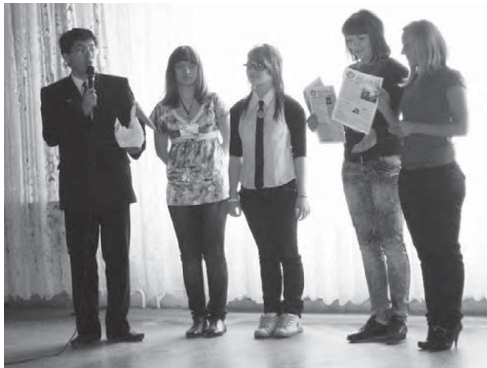
• «Акулам пера» из школьных стен - большого плавания!