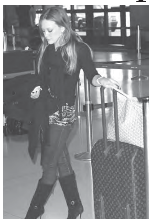
● Предстоит вояж? Оцените багаж.