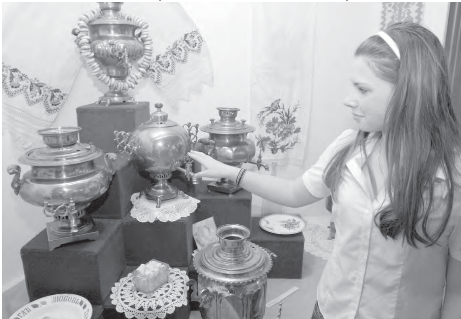
• Преданья старины глубокой хранит музей тишина.