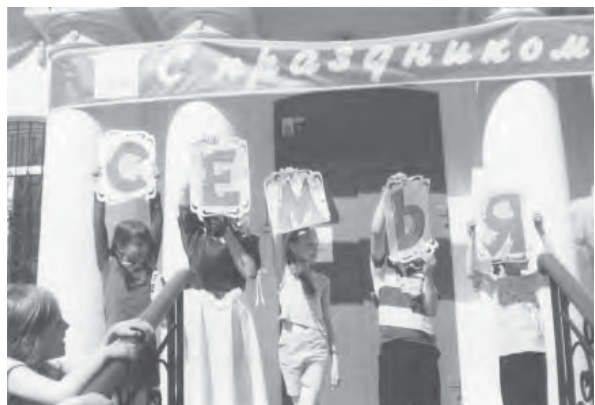
Без сомнений, день семейный – лучший день в году!

В любой семье главное внимание уделяется детям. Поэтому все внимание взрослых в этот день было уделено ребятне, чьи родители не могут себе позволить лишних трат на кино, аквапарк и другие развлечения.