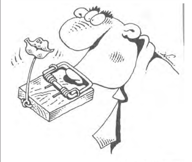
Рисунок Игоря КИЙКО

Для «спокойного» состояния организма перерыв между приемами пищи не должен превышать 5 часов! Он должен «знать», что пища будет поступать регулярно, поэтому накапливать жир впрок не нужно.