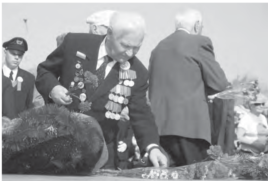
Цветы павшим от живых.

Великая Отечественная война стала тяжелым испытанием для советского народа. 9 Мая – это, по прошлому, слова благодарности людям, прошедшим сквозь суровые годы войны, внесшим свою лепту в правое дело.