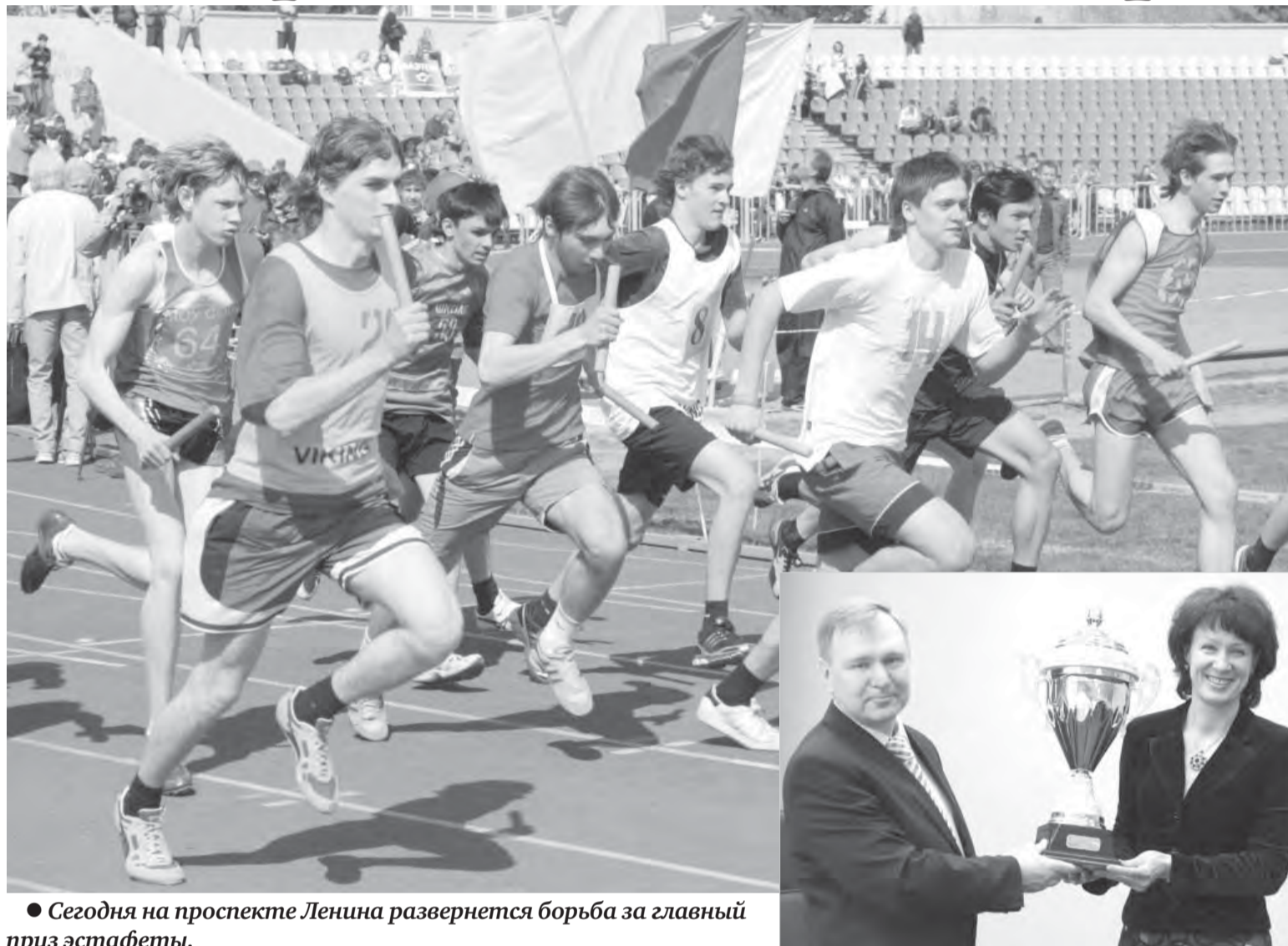
● Сегодня на проспекте Ленина развернется борьба за главный приз эстафеты.