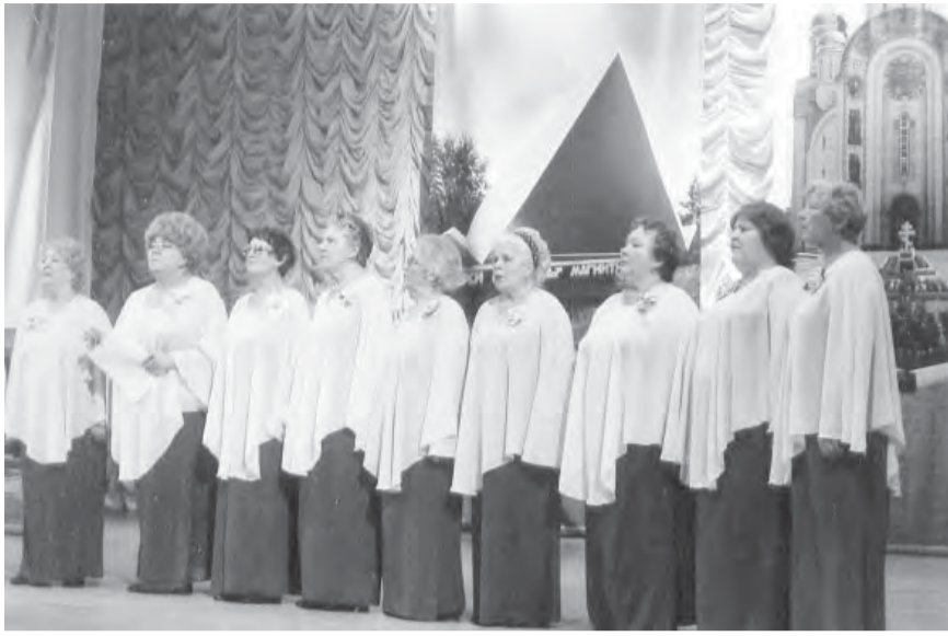
«Светелка» на сцене Дворца им. С. Орджоникидзе.