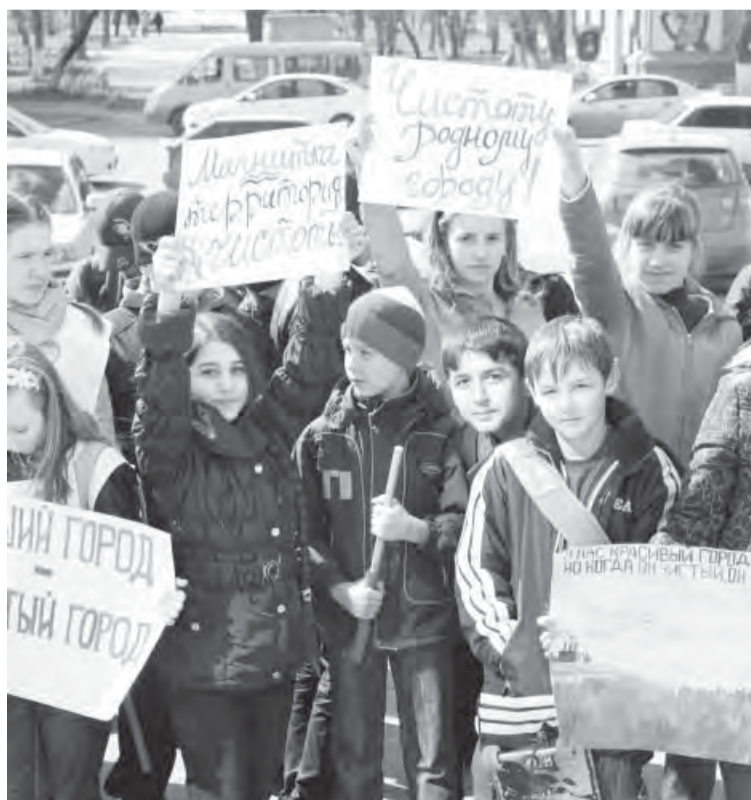
● «Зелёные» на улицах Магнитки.

Цель акции – не только уборка, но и развитие социальной активности молодежи, привлечение внимания жителей города к санитарному состоянию улиц и жилых кварталов. Администрацией района и городским парламентом школьников к этому дню были разработаны и выпущены агитки – обращения к жителям и гостям горо-