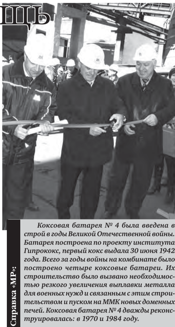
Справка «МР»: Коксовая батарея № 4 была введена в строй в годы Великой Отечественной войны. Батарея построена по проекту института Гипрококс, первый кокс выдала 30 июня 1942 года. Всего за годы войны на комбинате было построено четыре коксовые батареи. Их строительство было вызвано необходимостью резкого увеличения выплавки металла для военных нужд и связанным с этим строительством и пуском на ММК новых доменных печей. Коксовая батарея № 4 дважды реконструировалась: в 1970 и 1984 году.

Генеральным подрядчиком капитального ремонта четвертой коксовой батареи выступило ЗАО «Металлургремонт-1», в тесной связке с которым трудились специалисты ЗАО «Русская металлургическая компания». Отметим, что в ходе ремонта было переложено верхнее строение огнеупорной кладки коксовой батареи и отремонтирована нижняя зона. Кроме того, произведена замена одного комплекта коксовых машин, выполнен ремонт электрического оборудования, модернизирована система управления батареями. Для улучшения условий труда обслуживающего персонала ручные приводы газоотводящих стоек заменены на гидравлические.