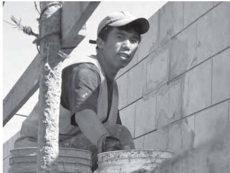
● Гастарбайтеры стране нужны, но немного.

Российское правительство решило упростить процедуру регистрации иностранных граждан, временно проживающих на территории РФ. В беседе с премьер-министром Владимиром Путиным руководитель Федеральной миграционной службы Константин Ромодановский отметил, что «иностранному гражданину для получения российского гражданства сначала получает разрешение на временное проживание и потом оформляет вид на жительство – собирает те же самые документы и проходит те же самые проверки. Может быть, здесь имеет смысл, например, убрать разрешение на временное проживание и начать с вида на жительство. Здесь чисто бюрократия и чисто нервотрепка для людей». Вместе с тем Владимир Путин заявил, что Россия должна привлекать иностранных рабочих в конкретные сферы экономики. По его мнению, делать это необходимо «таким образом, чтобы они, во всяком случае, сегодня, в условиях экономического кризиса, который до конца еще не преодолен, не создавали не-