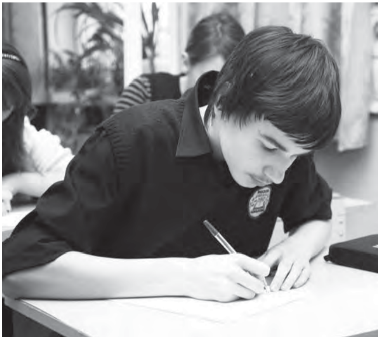
класс. Ну а участников стало больше, чем в прошлые годы: если в 2008 году на отборочный этап вышли 394 ученика,

Возрастной «спектр» участников достаточно широк: свою грамоту показывали ребята с третьего по одиннадцатый