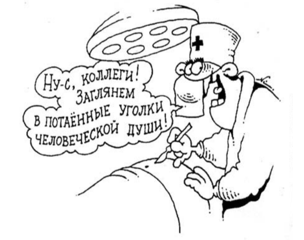
Рисунок Игоря КИЙКО