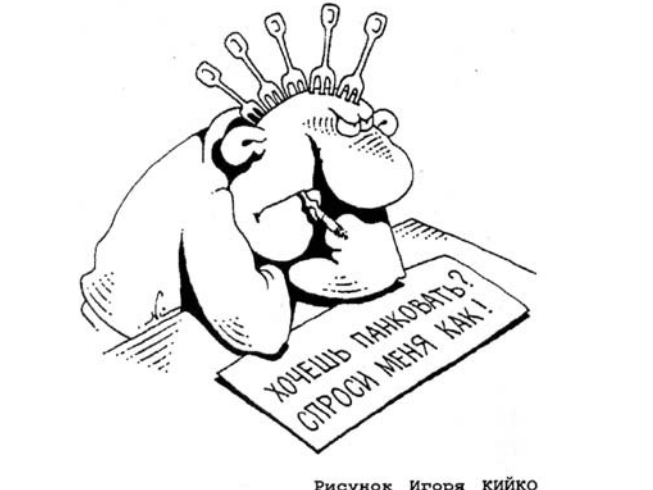
Рисунок Игоря КИЙКО