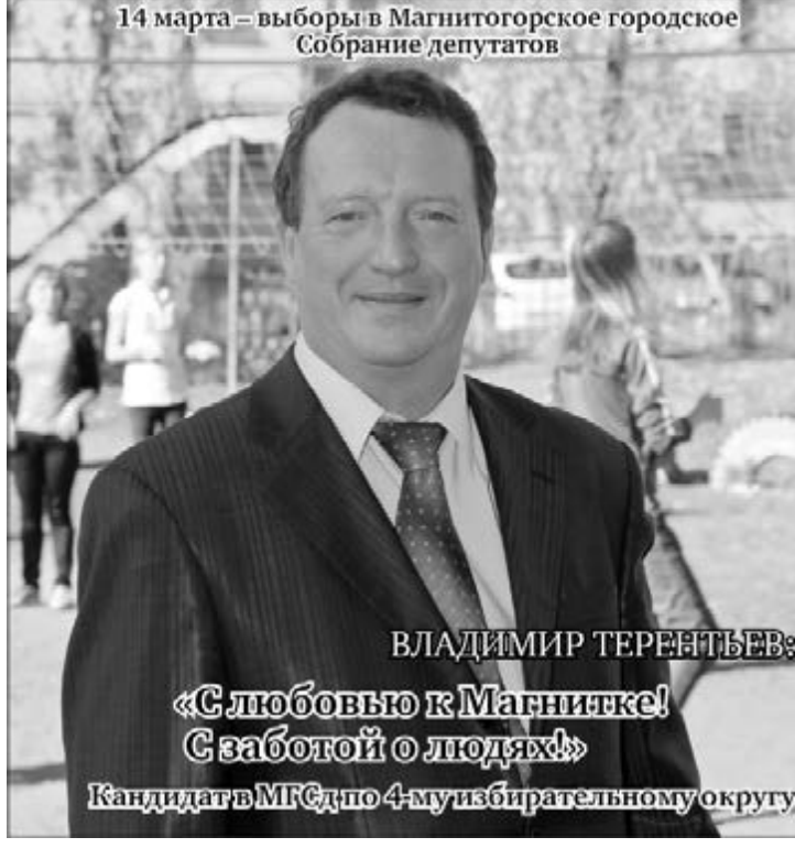
14 марта - выборы в Магнитогорское городское Собрание депутатов