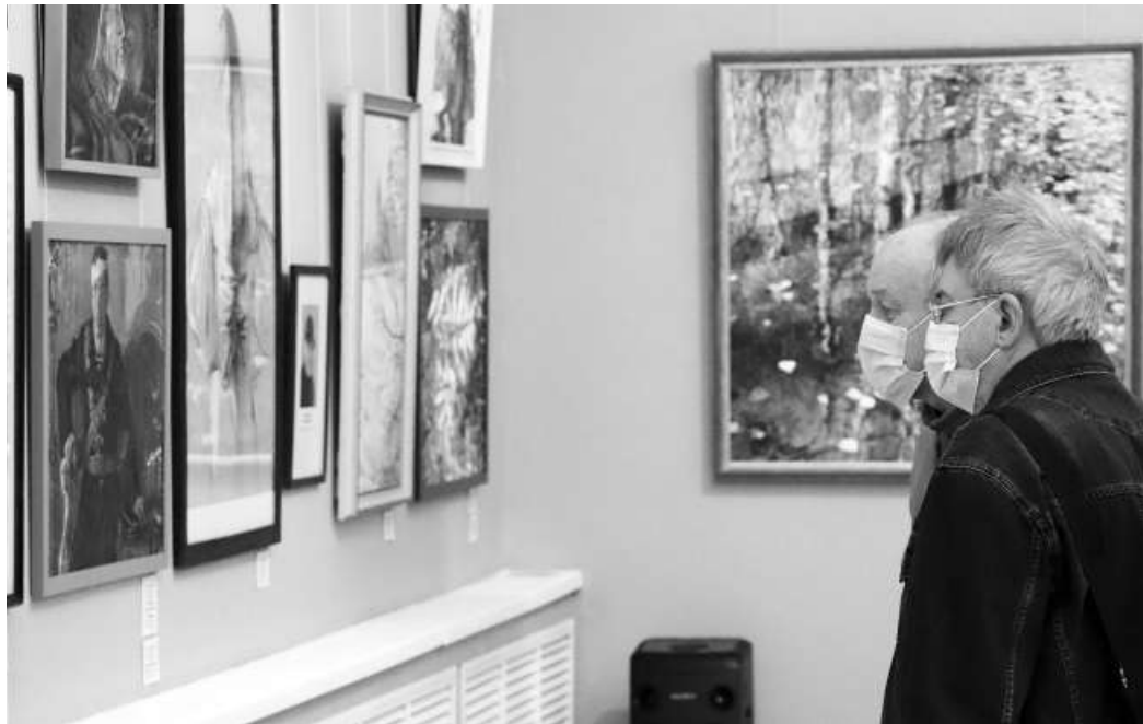
Интересно смотреть, как с годами расцветает индивидуальность, совершенствуется техническое мастерство.

Как растет и развивается художник? Почему в творчестве столь важен хороший старт? Поразмышлять об этом дает возможность выставка «Выпускники», которая открылась в Магнитогорской картинной галерее