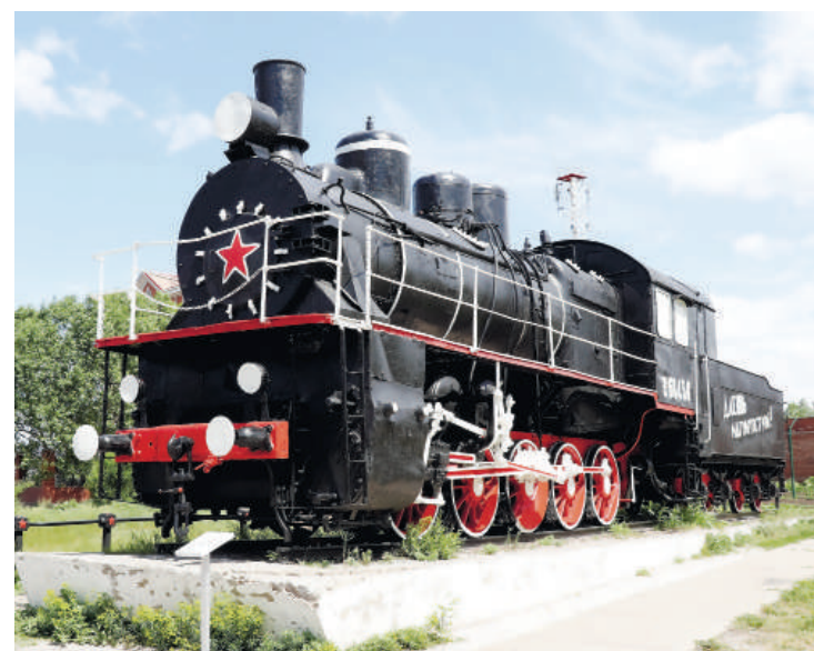
Маршрут прогулки доступен для всех желающих.

шателей сопровождает голос мужчины, который вернулся в родной город после долгого отсутствия. По пути от Привокзальной площади до монумента «Тыл – фронту» можно услышать знаменитого сталеваара, оперную диву театра оперы и балета, «оживший» первый капитальный дом на правом берегу Магнитогорска. В ходе экскурсии можно узнать о малоизвестных исторических фактах и знаменитых соотечественниках.