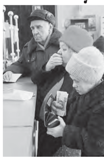
ипотечных бумаг, рублевых и валютных депозитов, а также ценных бумаг международных финансовых организаций. Средства «молчунов» автоматически окажутся в «расширенном» портфеле – более доходном, но и более рискованном. Для тех же, кто все-таки хочет играть по старым правилам, то есть исключить даже теоретический риск потерять свои пенсионные сбережения, фонд оставил и прежний «базовый портфель». Правда, теперь, чтобы его не трогали, человеку нужно будет попросить об этом письменно.

Новый «расширенный» портфель формируется из государственных ценных бумаг РФ и ценных бумаг субъектов Федерации, облигаций российских хозяйственных обществ,