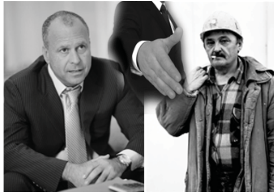
понятию «демократия». «Демократия нам нужна, прежде всего, для того, – напоминает он, – чтобы власть могла максимально опираться и использовать коллективный опыт и разум рядовых граждан, тех, кто своим трудом создает материальные и духовные ценности». Настала пора вдохнуть новую жизнь в работу тех же профсоюзов, ветеранских, молодежных

Профессор делает попытку вернуть изначально значение многократно обогатившему, вывернутому наизнанку