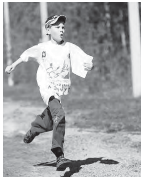
по спортивному ориентированию в мире. Оно среди таким популярным спортивно-массовым мероприятием, как «Лыжня России» и «Кросс наций». Около двухсот тысяч участников в разных городах получили в руки карты и отправились в леса и парки на поиски красно-белых призм.

Впервые «Российский азимут» был организован и проведен в 2006 году. Это самое масштабное и многочисленное соревнование