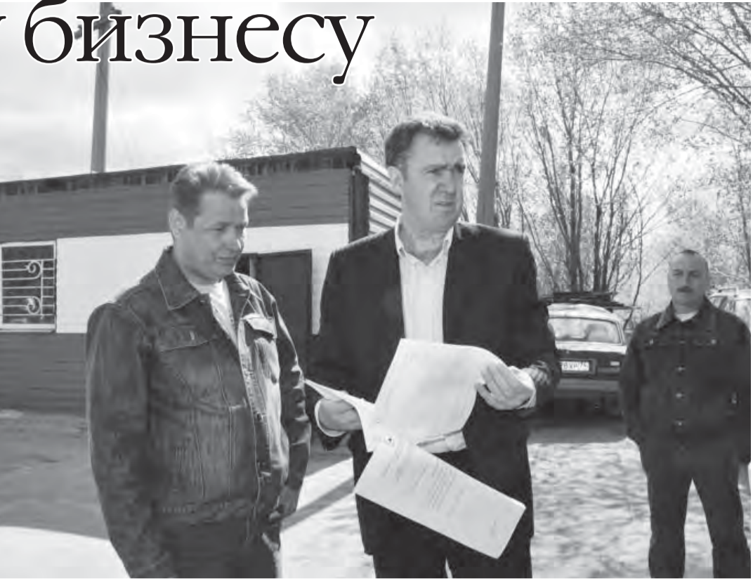
ности по арендной плате в городской бюджет с предпринимателем пролонгируют договор аренды. Тем самым у города появится возможность пополнять бюджет, а у частного предпринимателя – заниматься привычным делом.

скважиной, которая на данный момент законсервирована. Глава оценил ситуацию на месте и вынес свое решение: «Я готов решать вопросы в пользу предпринимателей при условии, что на данном предприятии будут сохранены рабочие места, а возможны и появления новых вакансий». Отдельное указание отдал глава комитету по управлению имуществом: включить скважину в план приватизации, а затем выставить участок на продажу либо отдать в аренду заинтересованным лицам. На 14-м участке также потребовалось вмешательство администрации города. В течение двух лет предприниматель не переводил средства за аренду земли, на которой разместил платную автомобильную стоянку и торговый комплекс. Своё положение он объяснял тем, что документацией на предприятии занимался его партнер, а он не был посвящен во все тонкости. Но последние два года начинающий бизнесмен проработал в одиночестве, вот и упустил арендную плату. Чтобы иметь возможность продолжить работать на арендованной земле, предприниматель обратился к главе города. Было принято решение пойти на встречу представителю малого бизнеса. После погашения задолжен-