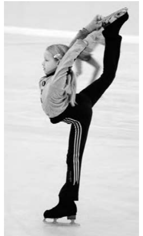
и тетеньки, веселые студенты, беззаботные школьники. И всем здесь будут рады.

Пора летних каникул прибавит забот. В прохладу под куполом ледового дворца поспешат утомленные зноем взрослые дяденьки