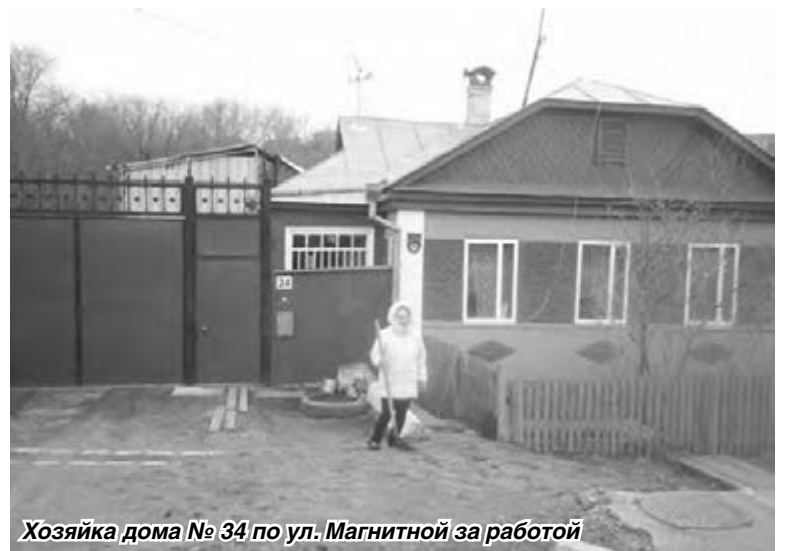
Хозяйка дома № 34 по ул. Магнитной за работой

Администрация района борется с нерадивыми хозяевами, вооружившись постановлением главы города «О наведении санитарного порядка на территории города» №2436-П от 20.03.2009 года и Правилами благоустройства территории г. Магнитогорска. Этой весной в ходе массовых проверок специалистами администрации района было выявлено более пятисот нарушителей «Правил благоустройства...» Им были выданы предупреждения о необходимости привести в порядок придомовую территорию и возможном привлечении нарушителей к административной ответственности. Нужно отметить, что подобные действия непопулярны, но необходимы и действенны. Чтобы