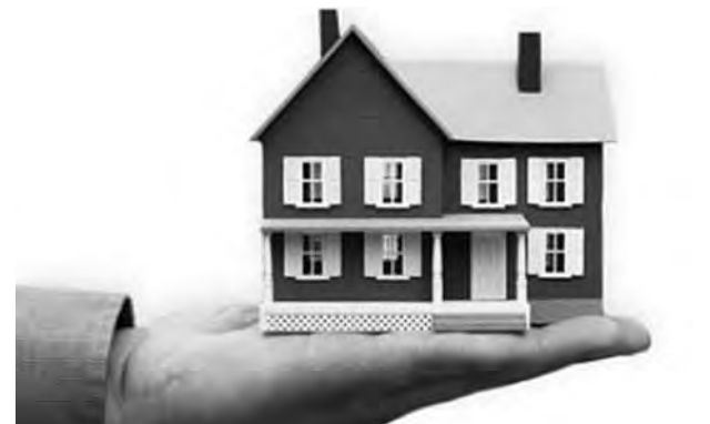
Выпуск подготовил Юрий БУРКАТОВСКИЙ.

– Могут. Ваши дети должны прислать доверенность на любого гражданина России, который от их имени в течение шести месяцев со дня открытия наследства подаст заявление о его принятии. Необходимо собрать все документы и справки для получения наследства, заплатить госпошлину и налоги до получения свидетельства о праве на наследство. Затем получить это свидетельство и зарегистрировать его в регистрационном отделе.