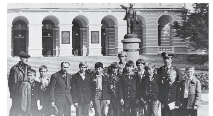
Магнитогорская делегация в Смольном /