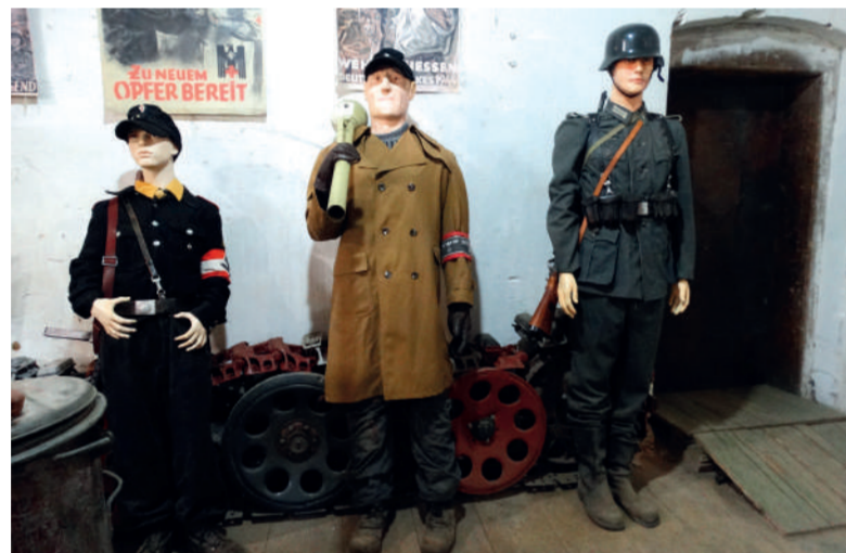
образцы военной формы с выставки клуба «Пехотинец»

Важная часть истории музея «Память» – традиционная реконструкция пленения генерала-фельдмаршала Паулуса, которую с 2006 года ежегодно проводит волгоградский военно-исторический клуб «Пехотинец» в историческом месте. Все эти годы по мере сбора исторических материалов менялся