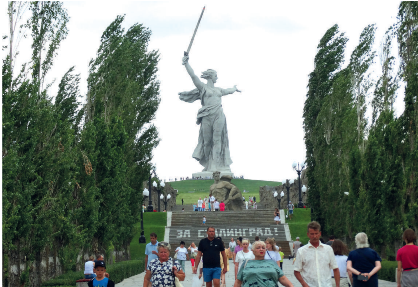
к главному монументу Волгограда ведет лестница из двухсот ступеней – по количеству дней Сталинградской битвы