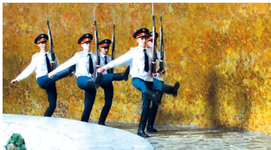
смена караула в Зале Славы на Мамаевом кургане