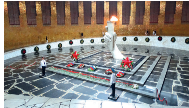
в Зале Славы на Мамаевом кургане

«Дорогой отец, сидим мы уже 1,5 месяца в этой дыре и почти нет надежды, что в скором будущем нас вывозят. С 1001 русские атакуют беспорядочно... Положение наше серьезное. Об этом и должен тебе