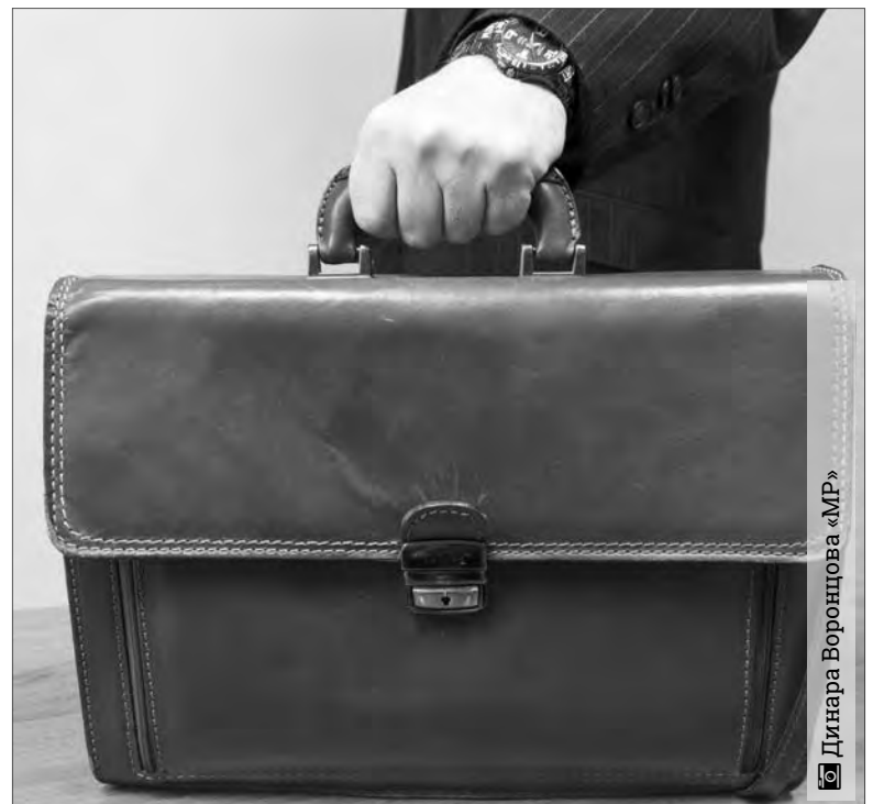
Динара Воронцова «МР»

График работы многофункциональных центров: понедельник 8.00-18.00; вторник 8.00-18.00; среда 8.00-18.00; четверг 8.00-20.00; пятница 8.00-18.00; суббота 9.00-13.00, без перерыва, воскресенье – выходной. Телефон для справок: +7(3519) 58-00-91 (единый многоканальный номер центра телефонного обслуживания МФЦ), e-mail: info@magmfc.ru.