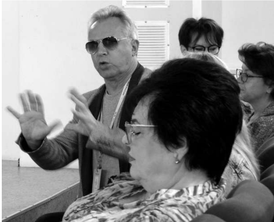
☒ Александр Ростов: реплика из зала /