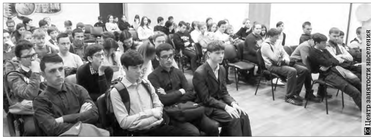
Центр занятости населения

На этот раз встреча состоялась в специальной (коррекционной) общеобразовательной школе-интернате №4. На лекции собрались девятиклассники, которым уже в этом году предстоит определиться с выбором дальнейшего пути. Не все ребята после окончания 9 класса продолжат обучение, и владея информацией, по достижении 16 лет смогут обратиться в центр занятости для подбора работы.