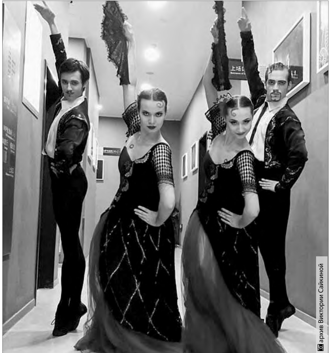
архив Викторией Сайкиной

– Поначалу, во время совместных репетиций с труппой театра, пришлось тяжело, – признается Александра. – Необходимо