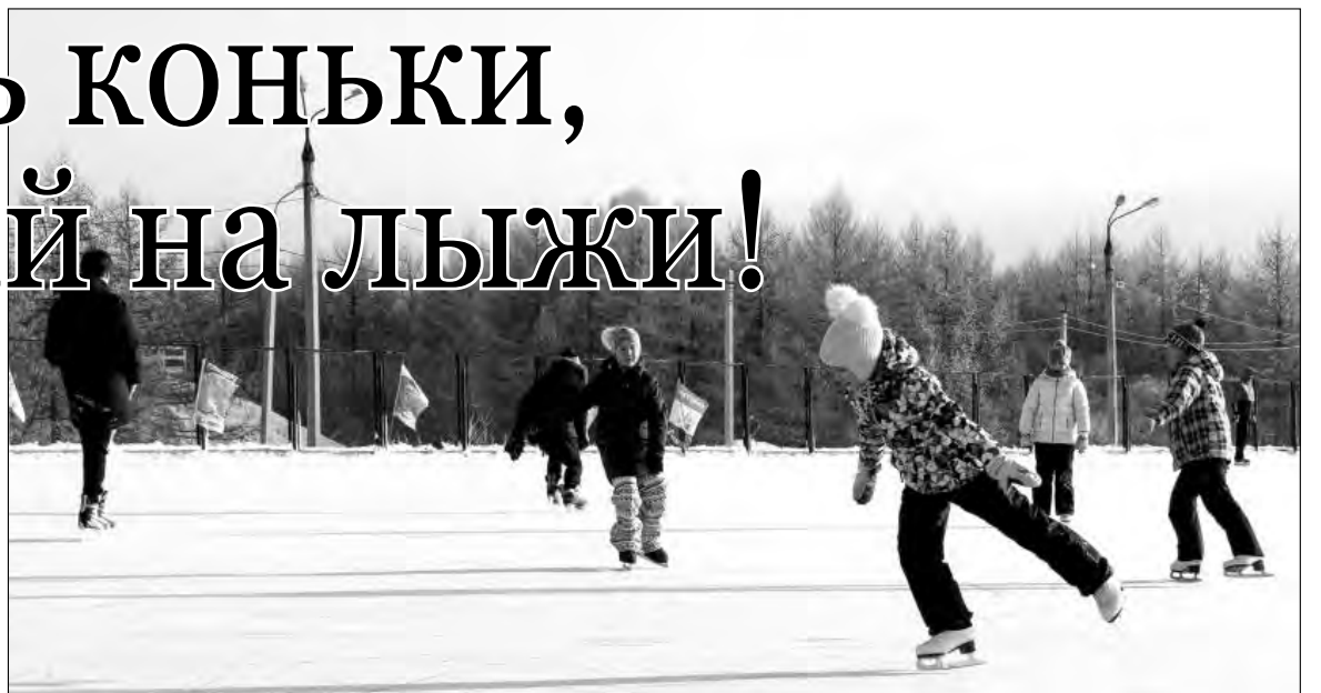
Ледовый каток в Экопарке уже принял первых гостей

Изменился за этот сезон Экопарк в целом: в течение октябрь-ноября были выполнены работы по расширению лыжной трассы до семи-восьми метров, проложены пешеходные дорожки для прогулок и занятий скандинавской ходьбой. Реконструирована горка для катания на ледяных и тюбингах: ее длина увеличилась с 60 до 120 метров, в два