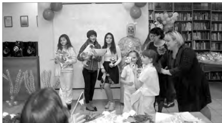
«Маленький принц» на французском зазвучал по-новому

Мероприятие, проведенное филиалом №2 объединения городских библиотек, было посвящено философской сказке «Маленький принц» Антуана де Сент-Экзюпери. Ребята инсценировали отрывки из произведения, продемонстрировав прекрасное владение французским языком, актерские способности, фантазию и выдумку. Родители школьников сшили для детей замечательные костюмы и