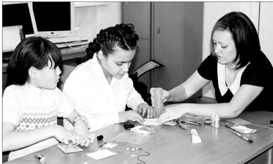
Проекты-победители направлены на социальную реабилитацию наиболее уязвимых категорий граждан

Автономной некоммерческой организации «Маленькая жизнь» грант размером почти в три миллиона рублей поможет справиться с нелегким делом организации необходимого нашему городу приюта для бездомных животных. Сейчас при поддержке городской администрации члены организации уже готовят помещение для социальной ветеринарной клиники. В дальнейшем на базе приюта будут проводить также воспитательную работу с детьми и молодежью.