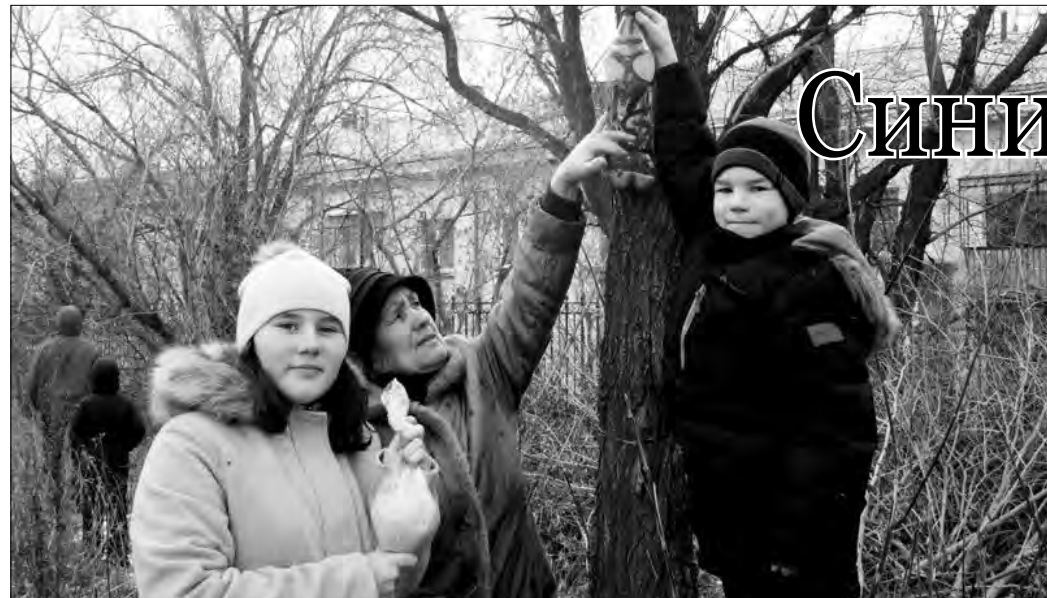
Эти ребята знают, как важно поддержать птиц зимой

Экологическая акция. Зима – трудное время для пернатых