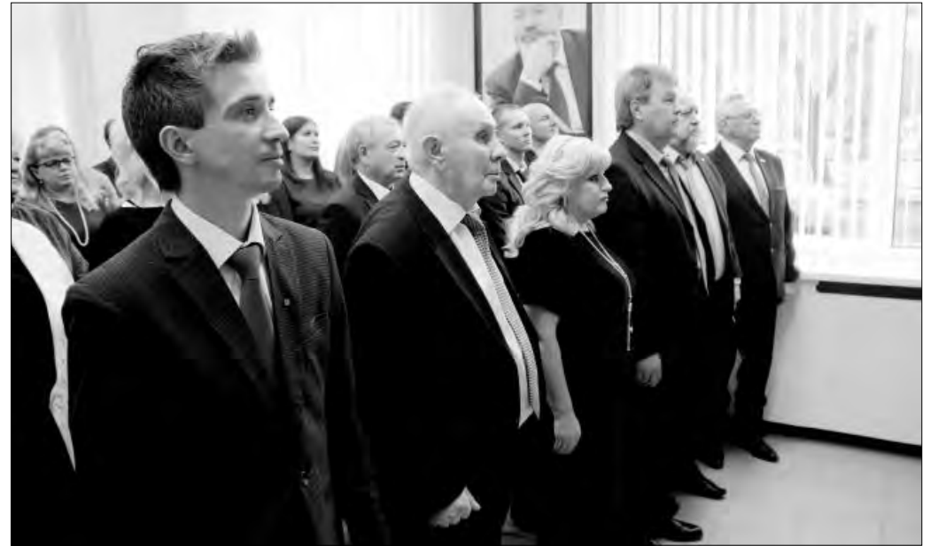
Награда в профессиональный праздник приятна вдвойне

С 2010 года лучшими в своей профессии признаны 15 магнитогорских юристов