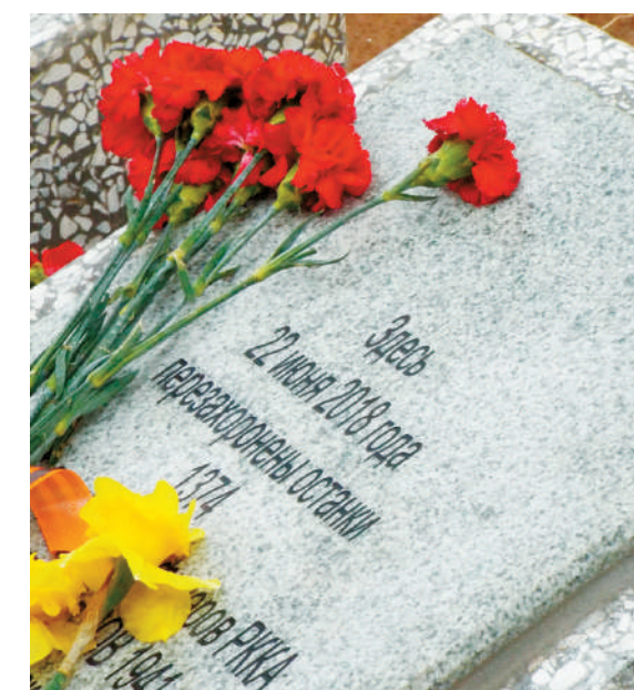
Братская могила во Ржеве