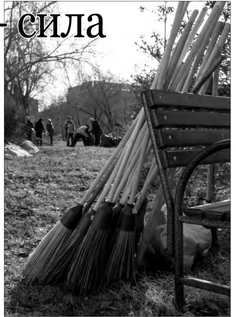
Мётлы в ожидании рабочих рук

Постановление администрации города предусматривает наличие нескольких кураторов предстоящих санитарных дней. Так, организация уборки на земельных участках, отведенных для проектирования и строительства, возложена на городское управление архитектуры и градостроительства. Управление экономики и инвестиций администрации курирует вопросы проведения уборки возле магазинов и торговых центров. За организацию наведения