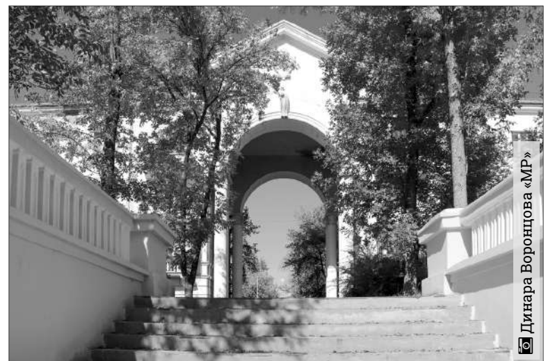
Динара Воронцова «МР»

По данным центра ФОБОС, к нам идет солнечный антициклон. Со среды до конца недели температура поднимется до 12-15 градусов, даже в ночные часы температура будет 5-7 градусов выше нуля. Конец недели ожидается солнечным и те-