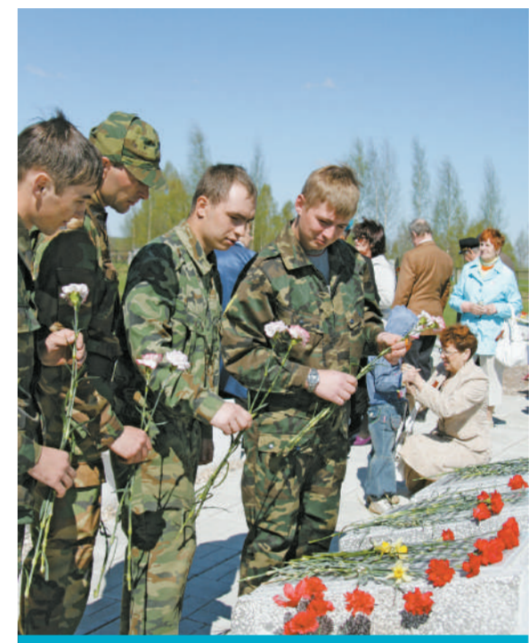
Мемориал во Ржеве