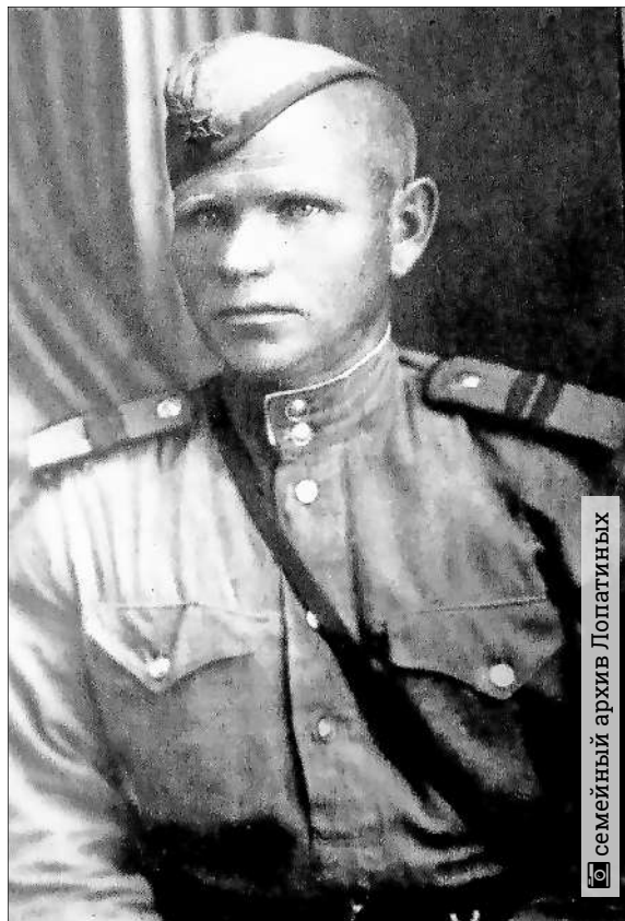
Семейный архив Лопатиных