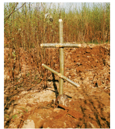
Здесь был найден солдат с медальоном