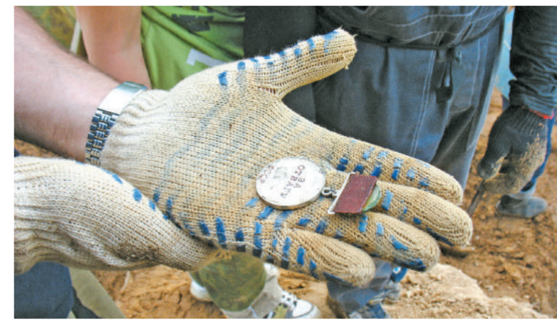
Медаль «За отвагу»

— В своей работе я не встречалась лично с «черными», — говорит автор книги. — Они работают поодиночке, глубоко в лесу, скрываются от случайных глаз. Ведь по закону, хранение или перевозка даже одного целого патрона или штык-ножа ведет к уголовной ответствен-