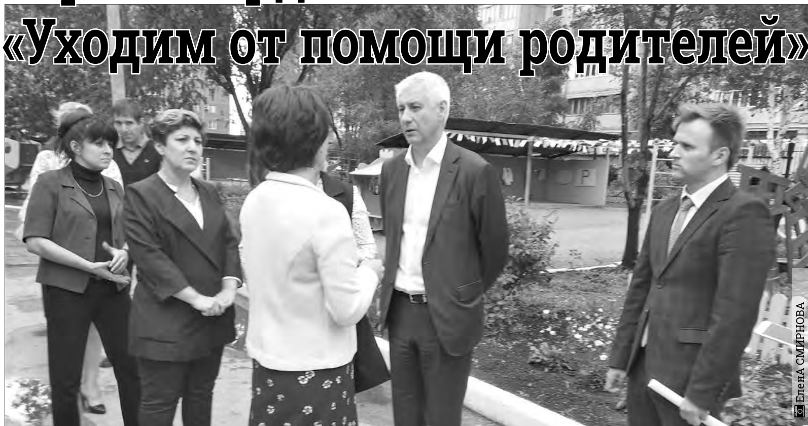
Градоначальник поставил задачу: привести все детсады в надлежащий вид за ближайшие год-два

Детские сады Магнитки становятся еще уютнее и краше