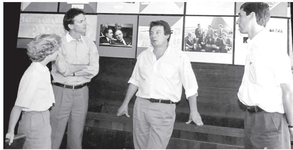
Журналисты из ГДР в редакции «МР», 1988 г. /