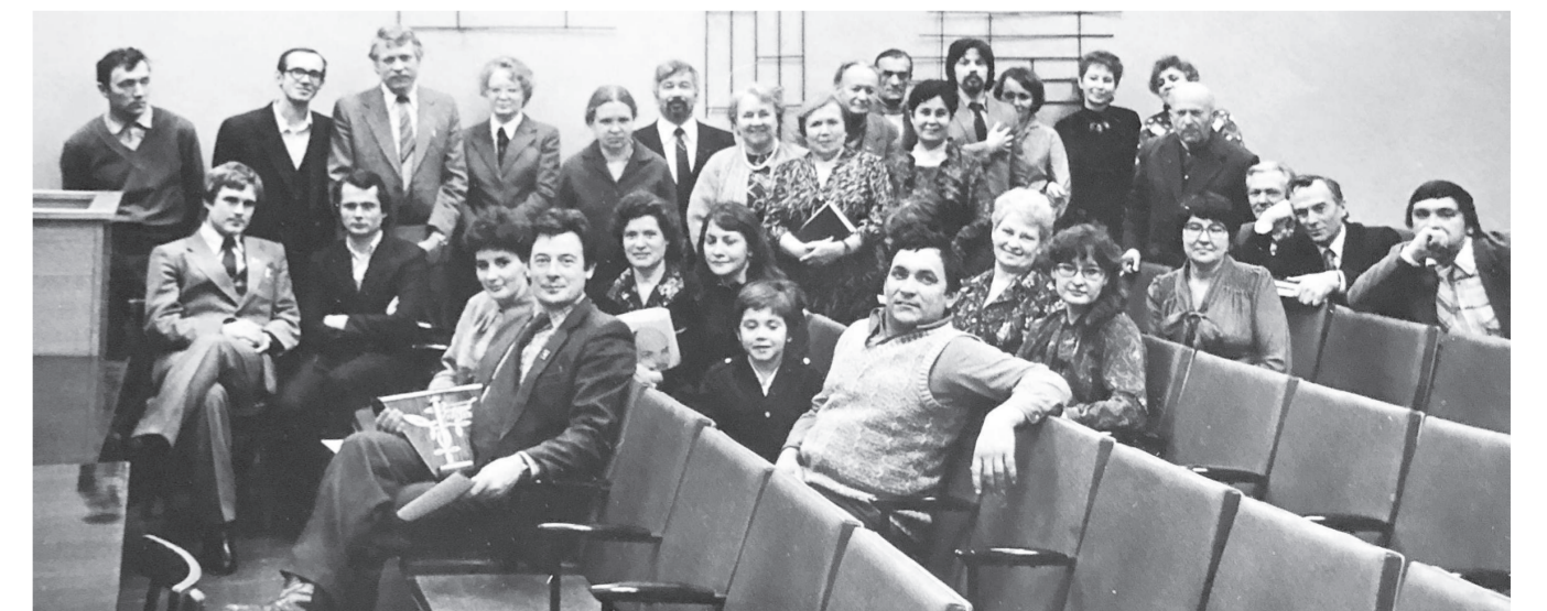
Награждение коллектива «МР» вымпелом «Золотой гвоздь», 1985 г. /