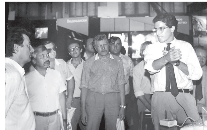
Журналисты «МР» на американской выставке «Информатика в жизни США» в Магнитогорске, 1988 г. /