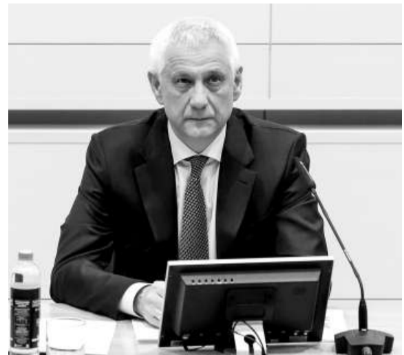
☒ / ФОТО: ЕВГЕНИЯ ЧЕРНОВА

Наряду с региональными в Магнитогорске реализуются мероприятия для семей участников СВО за счет средств местного бюджета. Среди них освобождение от родительской платы за оказание оздоровительных услуг в организациях дошкольного образования, бесплатный проезд в городском транспорте студентам и учащимся, обучающимся по очной форме обучения, бесплатные путевки в МБУ «Отдых» по программам «Лесная школа», «Школьная неделька». Предоставляются бесплатные путевки в городские лагеря с дневным пребыванием. Единовременная выплата в размере 15 тысяч рублей положена супругам лиц, призванных на военную службу по мобилизации. С полным перечнем предусмотренных на всех уровнях